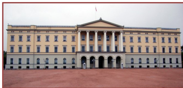
Det kongelige slott