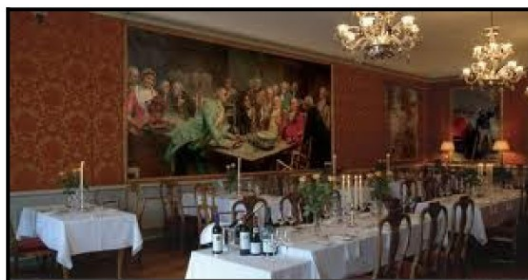
Den store spisesalen