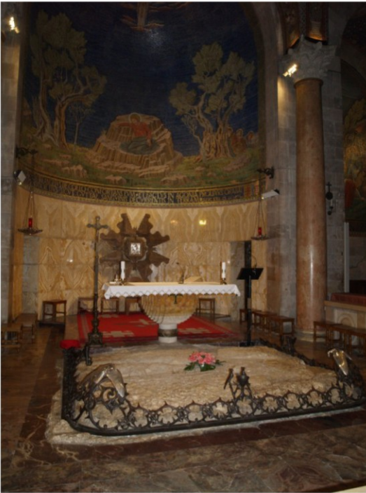
Store mosaikkbilder både utvendig og innvendig i Basilica of Agony