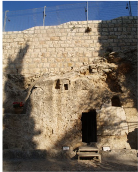
Gravhulen som kan ha sett slik ut på Jesu tid.