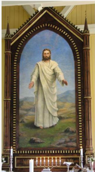
Altertavlen malt av Valborg Luth i 1899

Kirken hadde fra først av et kors som altertavle, men i 1899 ble det bevilget midler til ny tavle, et originalmaleri av kunstner Valborg Luth, kanskje inspirert av Bergprekenen.