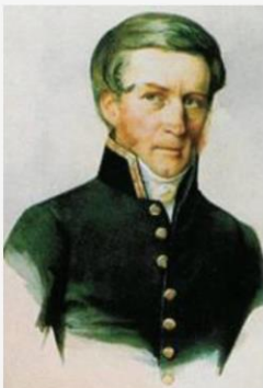
Carl Axel Gottlund 1796-1875

Den viktigste årsaken til det var den finske filologistudenten Carl Axel Gottlund f.1796, kalt Finnskogens Apostel, som i 1821 gjorde en reise i de norske og svenske finnskoger. Han ga mot og inspirasjon til å reise kirker og til å starte skoleundervisning i hjemmene i de finsktalende områdene på norsk og svensk side av riksgrensa.