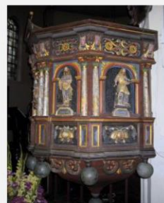
Prekestolen i Nes kirke