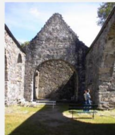
Nes gml kirke