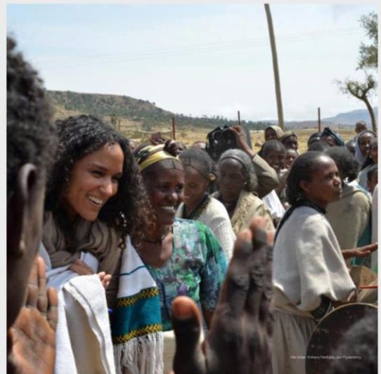
Trygg vei til vannposten

Når en landsby får en god brønn, fører det til at kvinner og barn får frigjort tid til utdanning og arbeid. Når turen etter vann blir kortere, er de også mindre utsatt for vold og seksuelle overgrep.