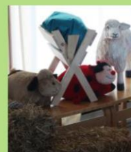
Julekrybba er på plass