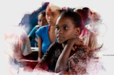
Barn får tid til utdanning

mennesker. Når en landsby får tilgang til rent vann, har dette ringvirkninger på mange områder. I mange land er det tradisjon for at kvinner og barn har ansvar for å hente vann.