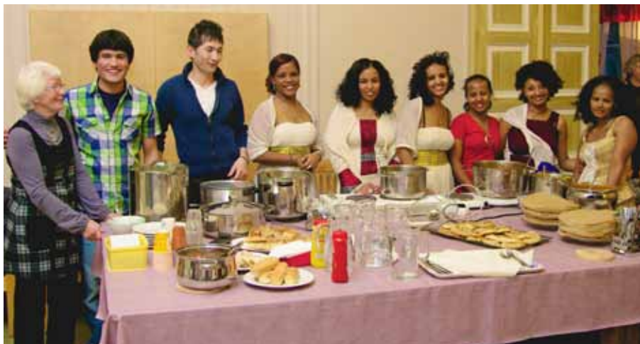
Dette er de som tilberedte de gode varmrettene på julemessa.