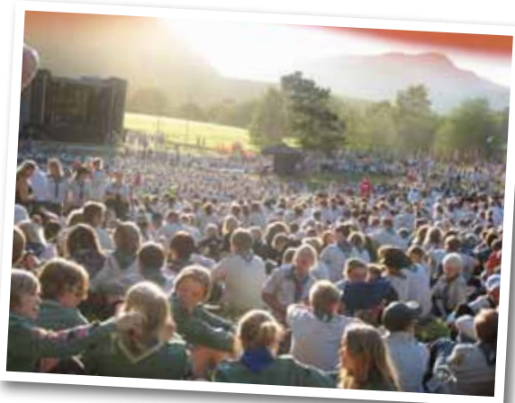
Verdensspeiderleir, 2011 i Sverige

I Kongsvinger er vi ca 50 speidere, fordelt på småspeidere fra 3. og 4. klasse og storspeidere fra 5. klasse og oppover.