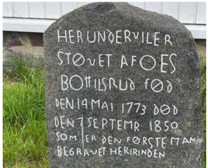
Bildet viser gravsteinen til den første som ble begravet ved Austmarka kirke.