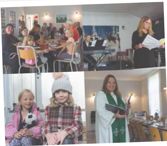
Glimt fra gudstjeneste på Kjerret.

Kilde: Erik Svenke Solum – Austmarka kirke 100 år 1858- 1958. Tekst: Laila Kristine Rønning.