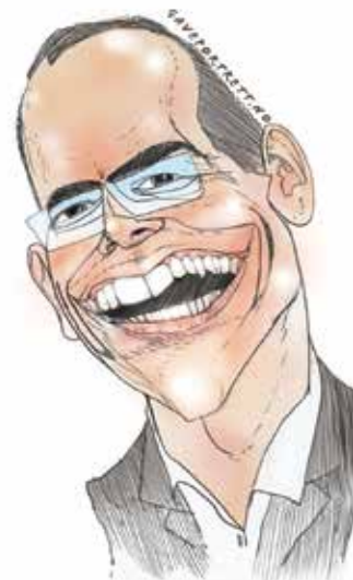
Illustrasjon: Eivind Haugstad

Kurt Tommy tenkte seg om, slik som menn med kalde føtter hadde gjort i tusener av år før ham, men kjente snart på at de gode rådene tross alt ikke var så dyre nå som han var opplyst. Det sto klart for ham at forestillingen om tid egentlig kun var en illusjon. Han gikk derfor tilbake 20 dager "i tid" og gjorde det slutt med henne som han tidligere på kvelden hadde tenkt å dele livet sitt med.