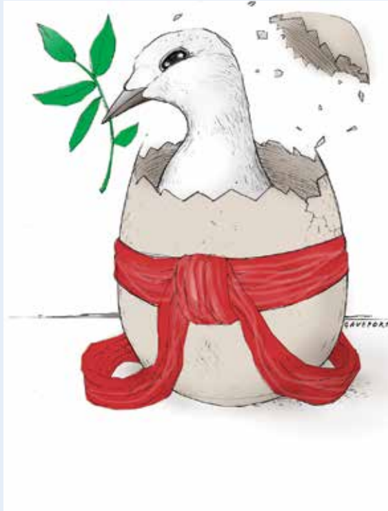
Illustrasjon: Eivind Haugstad

Tror jeg lærte av Dylan at det er lov å si at en tror på noe og at det å stå for noe er bra, og at det finnes et svar hvis en søker med et helt hjerte.