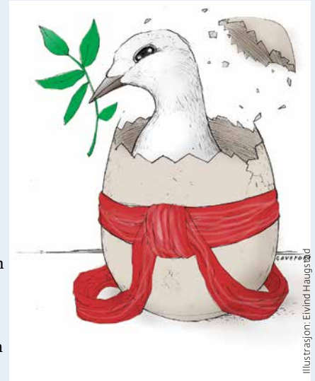
Illustrasjon: Eivind Haugsbø

Den enorme og grensesprengene nåden som vi finner i 'Come on up to the house' eller i sangen 'Never let go' 'I'll lose everything' 'But I won't let go of your hand' En av de mest spilte sangene mine er en sang som Tom Waits synger duett med en uteligger som befant seg under et TV opptak på Waterloo station i London. I bakgrunnen høres en mannstemme som synger: 'Jesus blood never failed me yet' 'This one thing I know, cause he loves me so' Kameramannen som gikk gjennom opptakene ble rørt av denne navn-