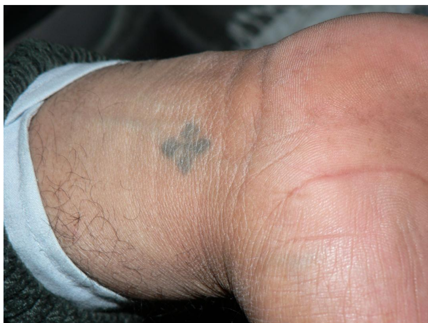
Kristen egypter m/ tatovert kors