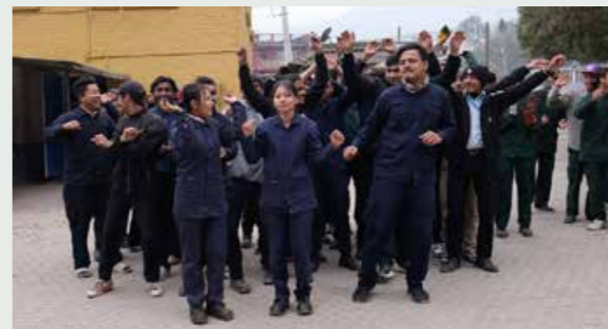
8000 unge har teke utdanning ved yrkesskulen. Blant disse er 23% jenter.

-Då eg såg studentane og måten dei handterte maskinene på, fekk eg ei kjensle av at nettopp desse kan utretta store ting for Nepal. Her vert det utdanna folk i mekaniske fag og elektro. Nokon vert tømrrarar, medan andre fokuserer meir på sveising. I løpet av dei siste åra har det også kome moderne CNC-maskiner på skulen. Eg er sikker på at BTI bidreg mykje for utvikling av teknisk kompetanse i Nepal, noko me treng sårt.