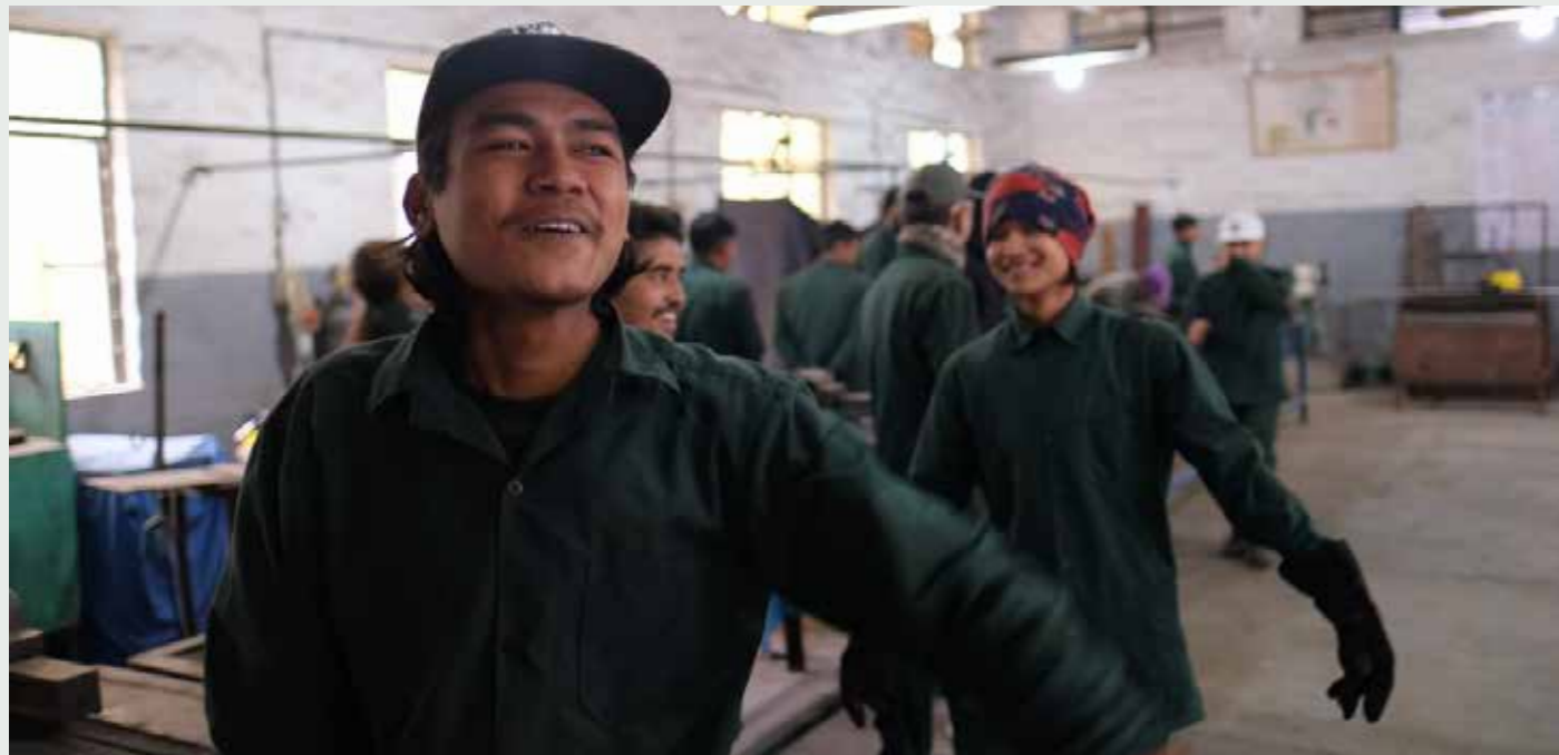
Elever på Butwal Technical Institute (BTI) kan sjå fram til betre høve for arbeid.

Tekst: Line Konstali