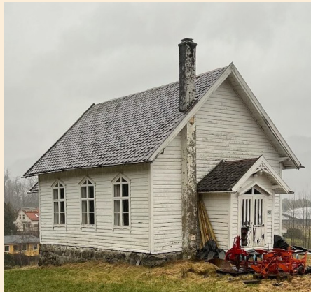
Baptist-kyrkja på Risa

Kyrkja står på Risa den dag i dag. Det er lenge sidan det har vore aktivitet i bygget, som no ligg under Ålgård baptistmenighet. Den lokale kontakten som er oppført, finn me i Nordrepollen. I bygdesoga A. Næss og O. Kolltveit gav ut i 1947, dreg dei linene for skipinga av baptistkyrkjelydar attende til reformasjonen. Dei presenterer tankar rundt kvifor det oppstod såkalla dissenterkyrkjelydar i Strandebarm og på Varaldsøy. Dei fortel at gruve drifta, og då særleg på Varaldsøy, var ein viktig faktor for at baptist-kyrkja i Strandebarm vart bygd. Det er viktig å merka seg at Strandebarm og Varaldsøy var knytte saman som eit sokn. I siste halvdel av 1800 vart det leita etter mineralar i heile Noreg. På Varaldsøy fann dei drivverdige forekomstar av svovelkis. Det vart bygt opp