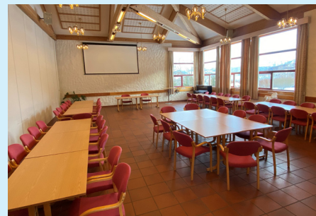
I Norheimsund har me hatt opptil 125 stk. på kurs