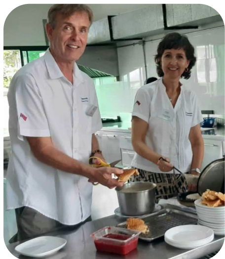
Det er mange som skal mettast med vafler og graut i Sjømannskyrkja

Alt godt til dere hjemme! Vi er naturligvis takknemlig for alle som husker på oss og kirken i Pattaya i bønn.