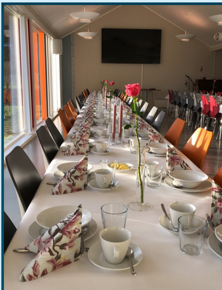
I kyrkjelydshuset i Strandebarm kan det dekkast til opptil 90 stk.