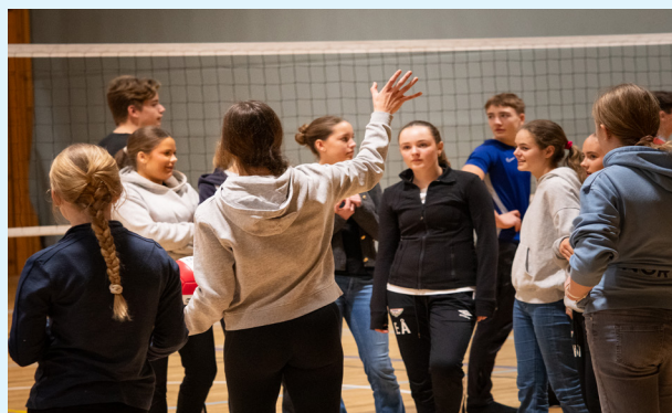
Volleyball er ein av mange kjekke aktivitetar på KRIK.