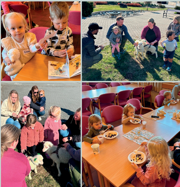
Krølletreff i Norheimsund 4.mai.

Krølletreff høyrer våren til, og alle som er døypte i Den norske kyrkja, vert inviterte til krølletreff - men alle tre-åringar er velkomne! Og skal tru om ikkje Han som er kyrkja sin Herre, og som også har tilnamnet den gode gjetar, smiler og syns at symbolikken og koplinga er framifrå?