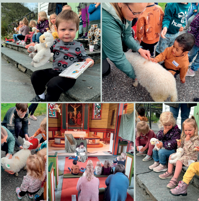
Krølletreff i Øystese 11.mai.

Krølletreff i Ålvik kyrkje, kvart 3.år med 3 årskull om gongen (3-, 4- og 5-åringar). I mangel av lam gjer ein ekte geitekilling nytten!