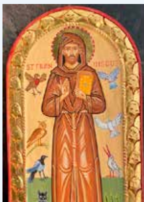
"Frans av Assisi"