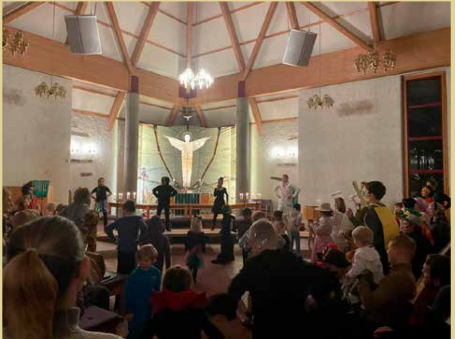
Liv og røre under «Bli-med-dansen» inne i kyrkjerommet

I møte med dette har kyrkja og gode samarbeidspartnarar i ei årrekkje invitert til Vennefest i kyrkja. Som ei lita motvekt, og som eit lokalt tilbod i trusopplæringsarbeidet vårt. 31. oktober var 120 barn i alle aldrar samla i Norheimsund kyrkje for å vera kreative, og med eit samla budskap: eg vil vera ein god ven. Foreldre og dugnadsarbeidarar fylgde på i rikt monn, og før kvelden var omme, hadde 250 små og store hatt ei triveleg stund, med fokus på å henta fram det gode i ei verd som ikkje alltid er like lys. Stor takk til alle som tok del – og ikkje minst til våre gode trusopplærarar som stod i brodden for det.