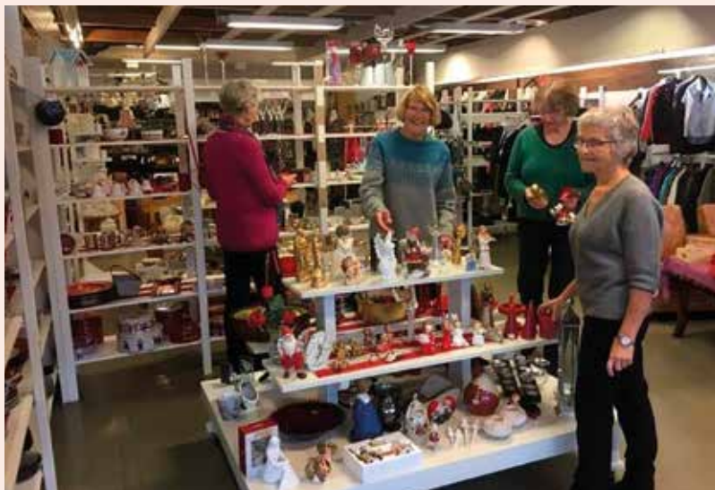
På biletet ser me dei friviljuge på Miljøbutikken Plant eit tre i Øystese pyntar butikken, med advents- og juleting. Gjenbruk er bra! (Red)