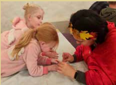
Neglelakk-verkstad ved Sevi på Vennefest