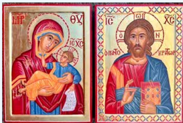
"Maria med Jesusbarnet" og "Kristus Allherskaren"