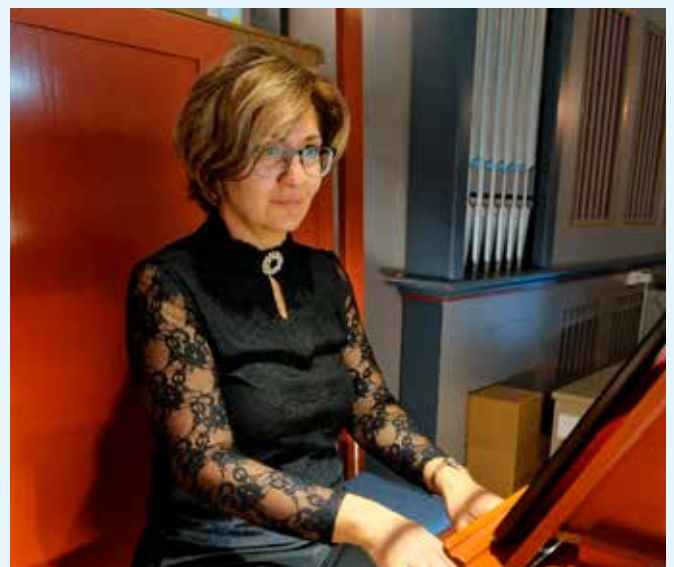
Sevi i konsentrasjon i Vikøy kyrkje