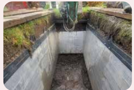
Stemplingskassen - ei solid nyvinning