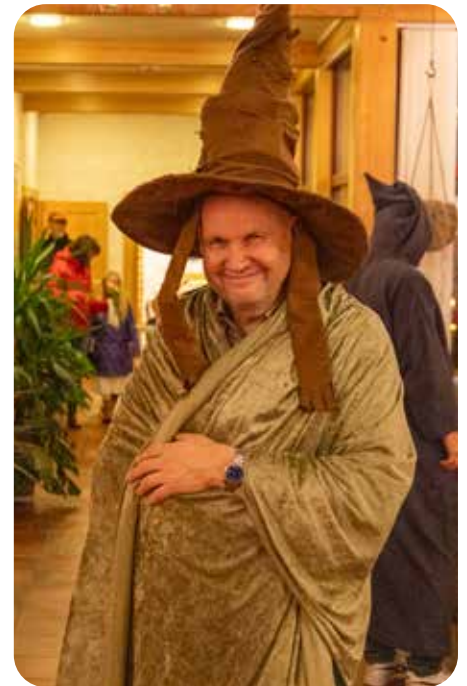
Tja - kva skal ein seia...?