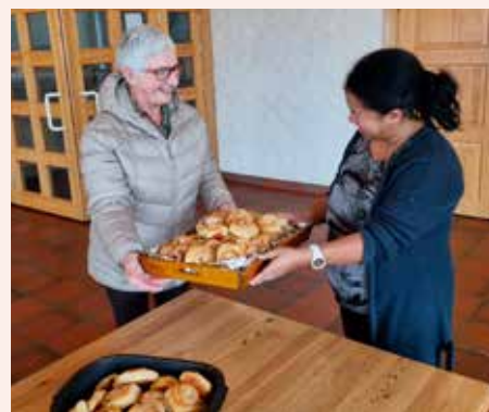
Kari og Mampion er eit godt team!

Dagen vart endå litt ljosare enn den var.