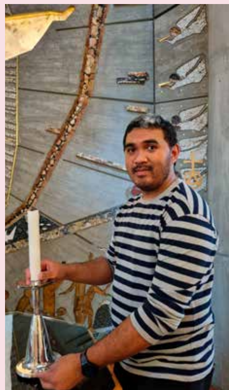
Franckie syter for at kyrkja er rein og klar til alle tider.

Ønsker dere alle en velsignet jul full av glede, fred og nærhet til Gud.