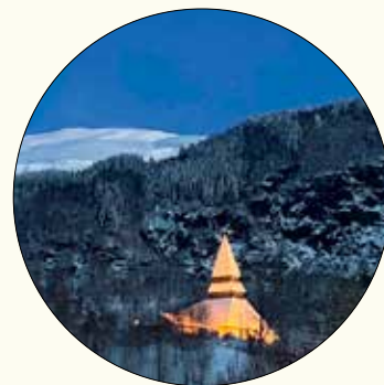
Ljøset fløymer over Norheimsund kyrkje