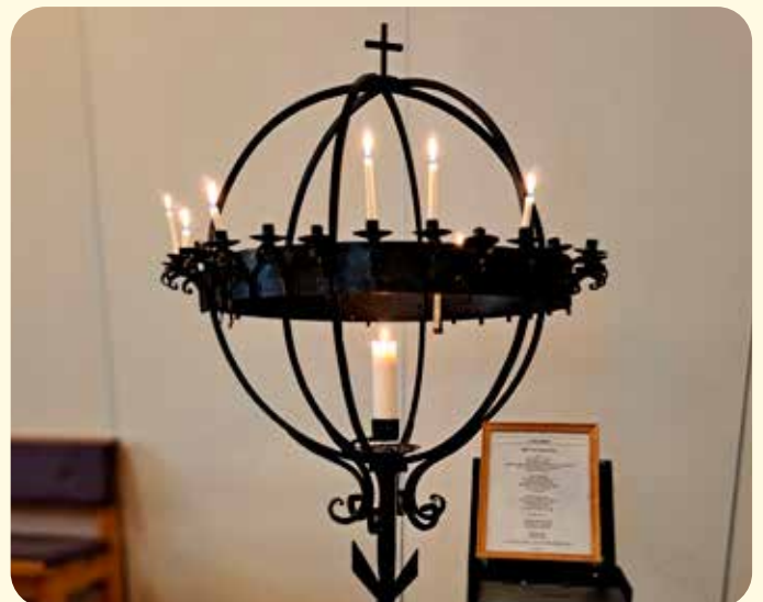
Lysgloben er etterkvart eit umisteleg inventar i kyrkjerommet

Set av veka i kalenderen, les plakatar og merk deg annonse i HF. Du kan også lesa om bønveke i Kvam på nettsidene våre: bedehusweb.no og kyrkja.no/kvam