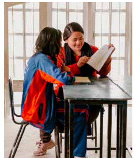
Kunnskap er nøkkel til alt!