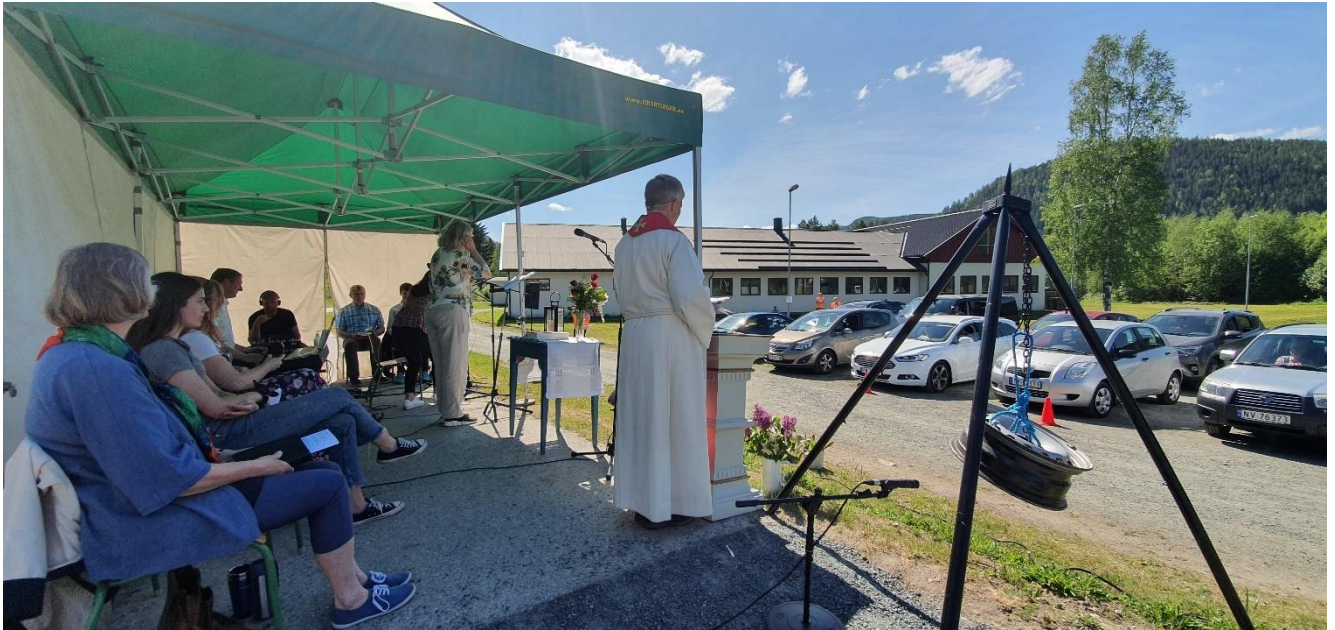
Drive-in-gudsteneste i mai.