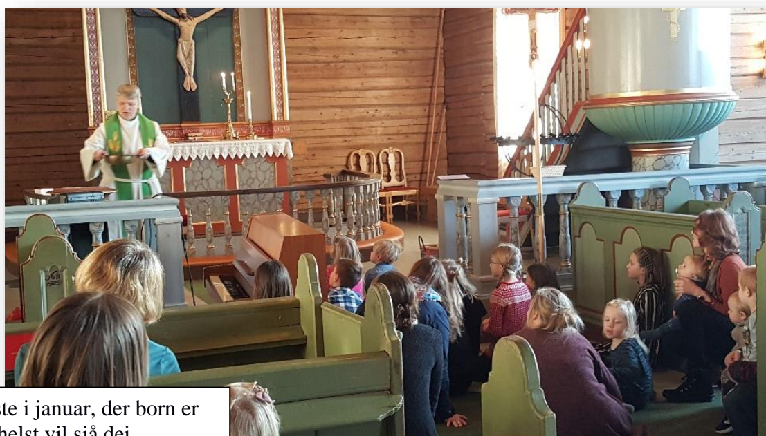
Frå gudsteneste i januar, der born er samla slik vi helst vil sjå dei.

Statistikken for gudstenester dette året ber sjølvsagt preg av dei restriksjonar som har vore gjeldande. I tillegg til dei som vi kan telje som frammøtte, har vi gjennom digitale sendeflater nådd ut med gudstenestetilbod til fleire.