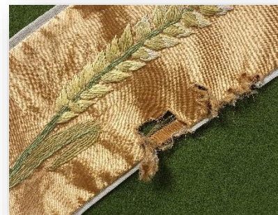
Messehakelen øydelagt av mus. Dette er eit av mange hol