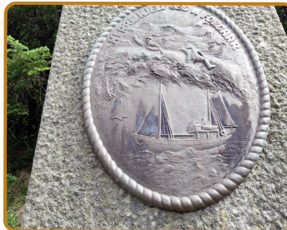
Ei anonym minnestøtte i Vevelstad på Helgeland, som ser ut til å vise både en havarert båt med desperate fiskere på hvelvet og en sjark i rolig vær. Tekst øverst: "Herre hjelp oss Vi forgaar!"

Vestfoldkysten kan neppe regnes blant de mest værharde og farlige. Men jeg må skynde meg å tilføye: mangfoldige av både fiskere og sjøfolk har mista livet også i våre strøk. Likevel, det lumske og farlige havet har ikke prega folkelivet og kulturen i den grad som vestpå og ikke minst nordpå.