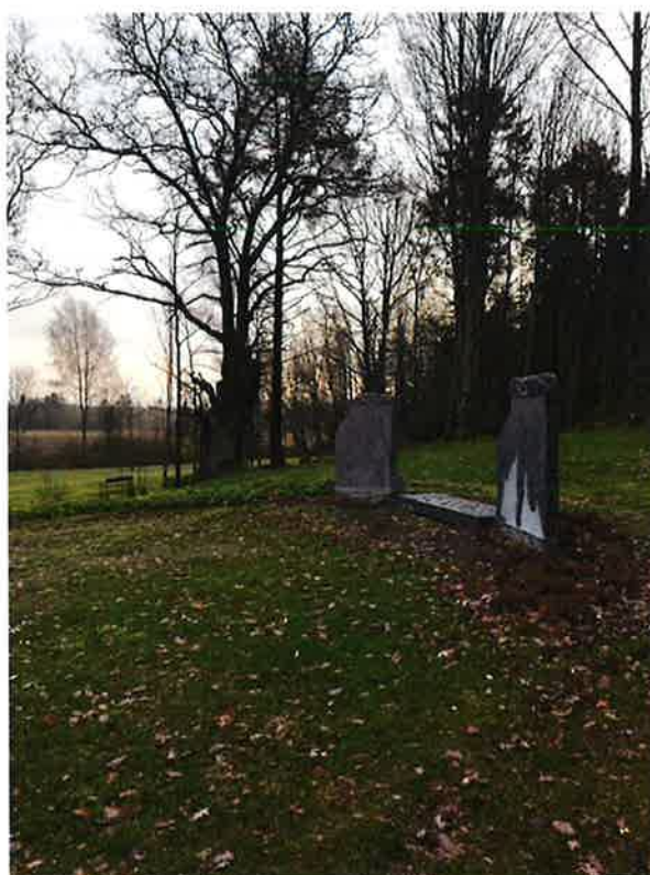
Navnet minnelund Tanum, høst 2018

For 2018 er Lardals tallgrunnlag også medregnet, det viser en større andel begravelser, noe som påvirker prosentvis fordeling i forhold til kremasjoner. Det er få gravstellavtaler knyttet til gravplassene i Lardal og gir derfor lite utslag.