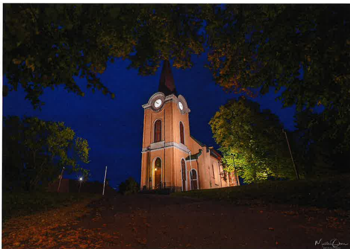
Larvik kirke i kveldsbelysning