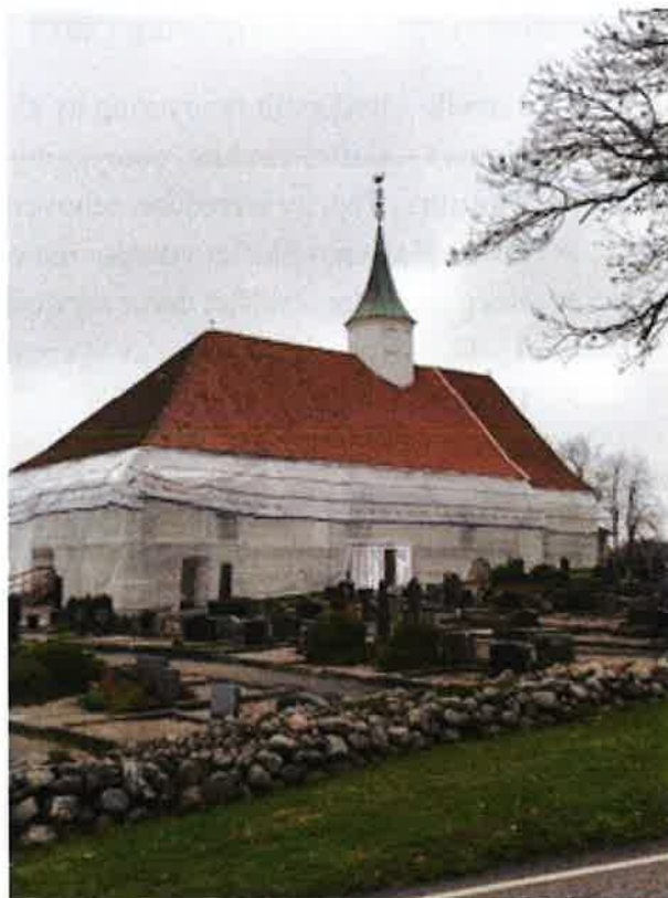
Tjølling kirke, høst 2018

Tjølling kirkes utvendige flater fornyes med kalk. Dette er en omstendelig prosess som innebærer at kirken vil være «innpakket» hele 2019 og frem til sommer 2020, før det er ferdig. Samtidig jobbes det videre med muligheten for å få åpnet sørportalen i kirken.