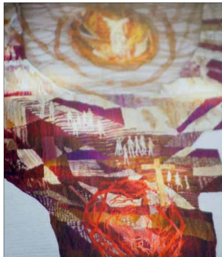
Altertavle fra Haugerud kirke.

“Renningen ligger som en herlig åker og venter at du skal så dine frø. For en god vevstol er som et herlig instrument med tusen renningstråder å spille på. Der kan tankene løpe foran i veven, så må hendene forsøke å holde tankene i tømme.”