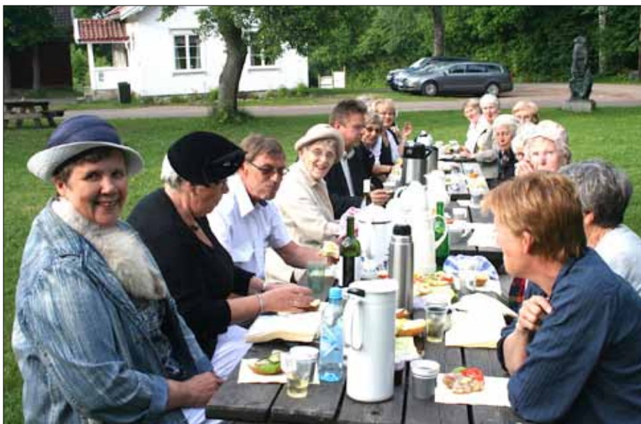
Fra en utflykt til Stokke bygdetun i 2010

Vi ønsker alle hjertelig velkommen på møtene våre, selv om du ikke er medlem. Og håper dere vil støtte vårt arbeid ved å kjøpe lodd av oss.