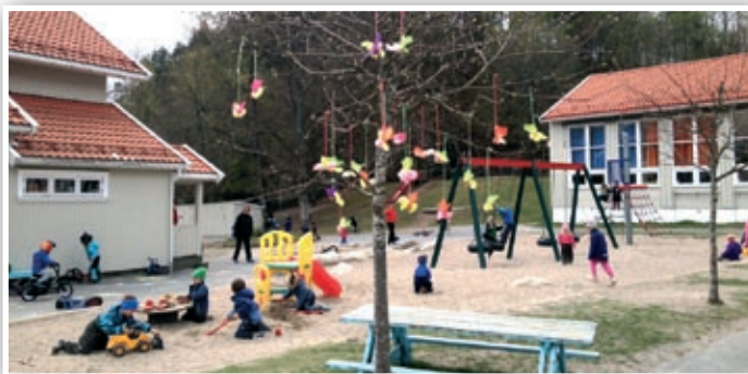
Lysheim barnehage ved Gamle Stavernsveien.

betaling! De tjente nesten 6000 kroner på dette, pengene som de ville