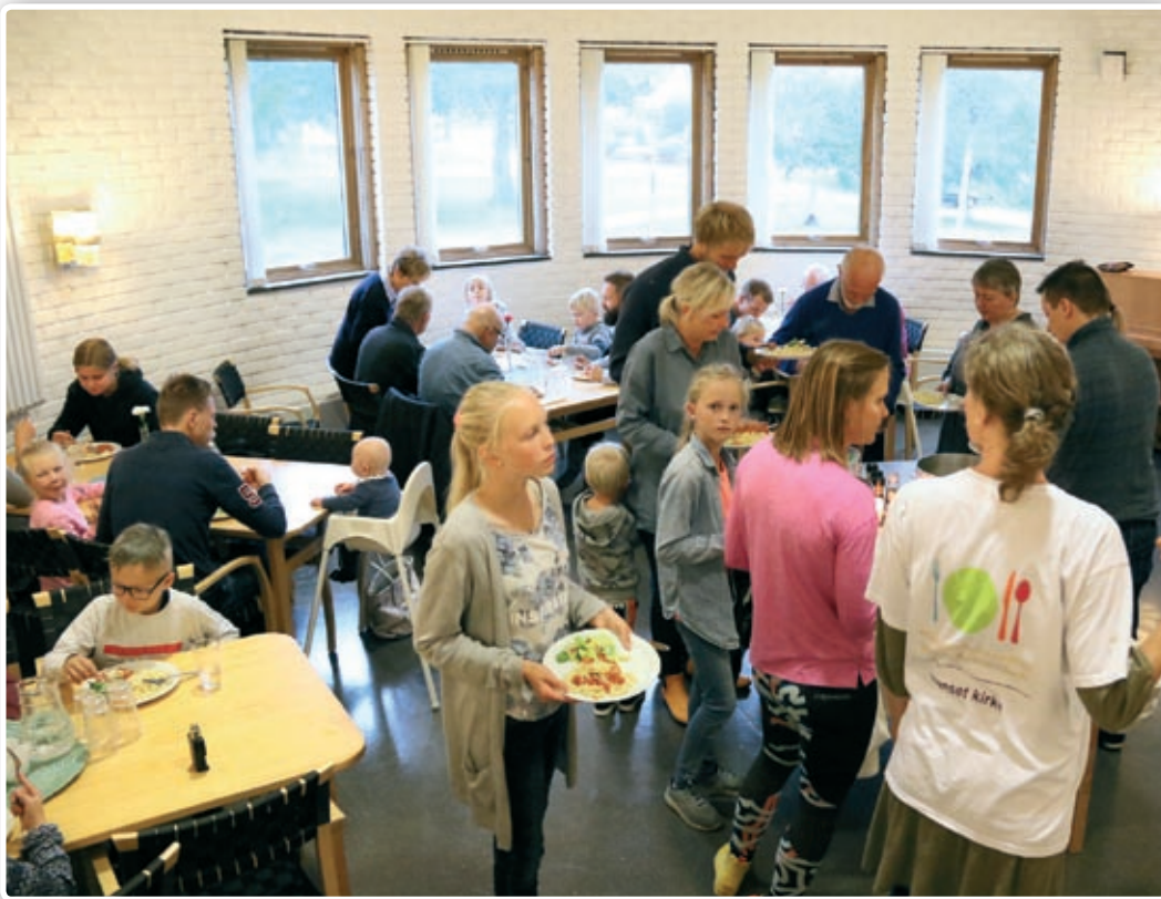
Bordfelleskap i peisestua. Når det er fullt her er det plass i menighetssalen.