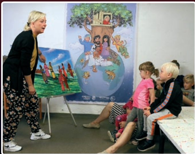
På søndagsskolen trives både små og store. Her fra gruppen med de små barna.

Kormiljø med sang, band, dans og drama, teknikk og media. Høstens store prosjekt lages av ungdommene selv og vil vises i Munken 12. november. Hver tirsdag kl. 18.30 - 21.00. Ungdom fra 8. klasse.