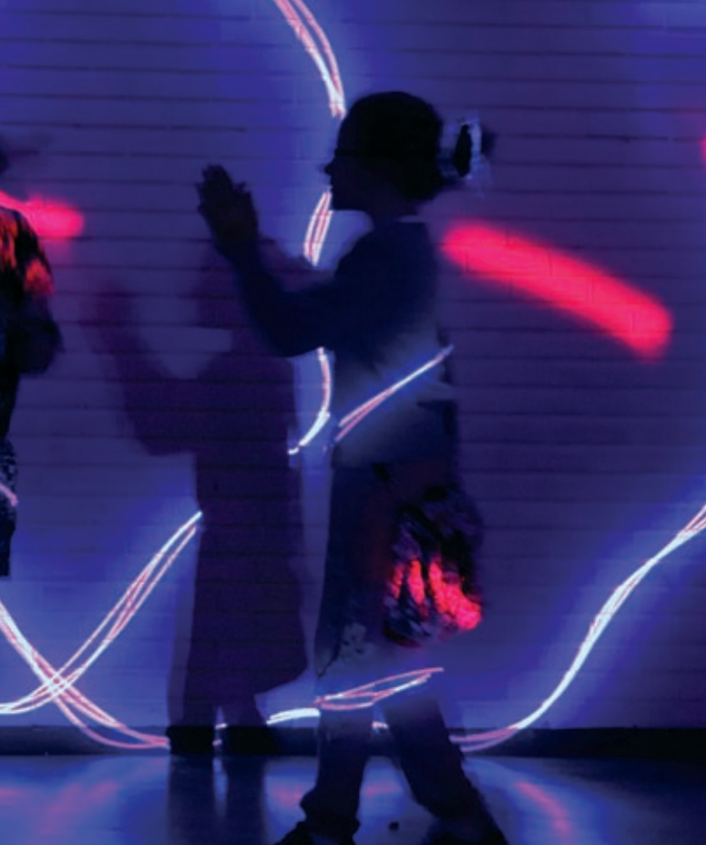
for enhver smak.