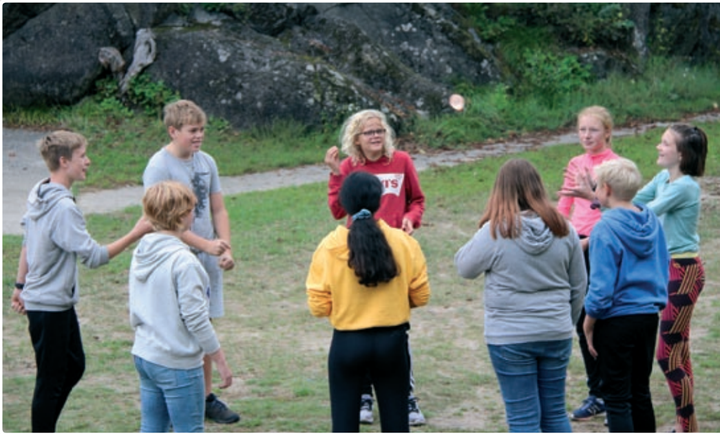
Ungdommene koste seg på konfirmantleir på Oksøya.