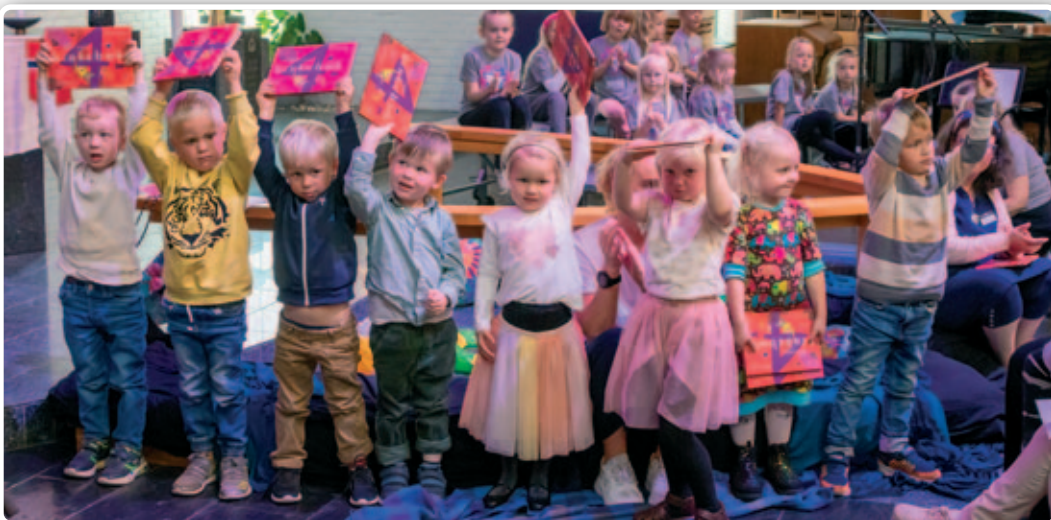
Det er utdeling av 4-årsbok på familiegudstjenesten i slutten av oktober.

Alle gudstjenestene begynner kl. 11.00. ■