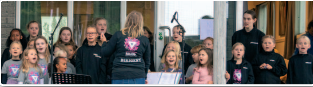
NaBaGo-korene sang også i fjor på Nansetdagen.