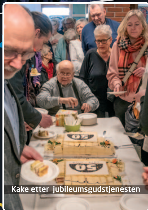
Kake etter jubileumsgudstjenesten

skrive navnet sitt på hvert sitt blad. Alle bladene ble hengt opp på treet som sto fremme i kirken. Dette minner oss om at vi hører sammen i Nanset kirke.