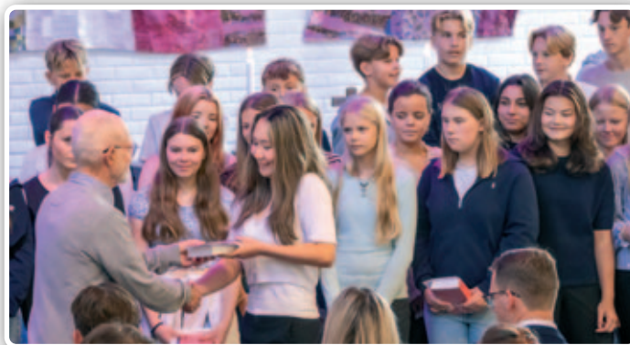
Årets konfirmantkull i Nanset fikk hver sin bibel.