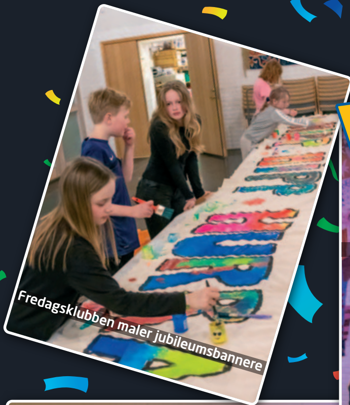
Fredagsklubben maler jubileumsbannere