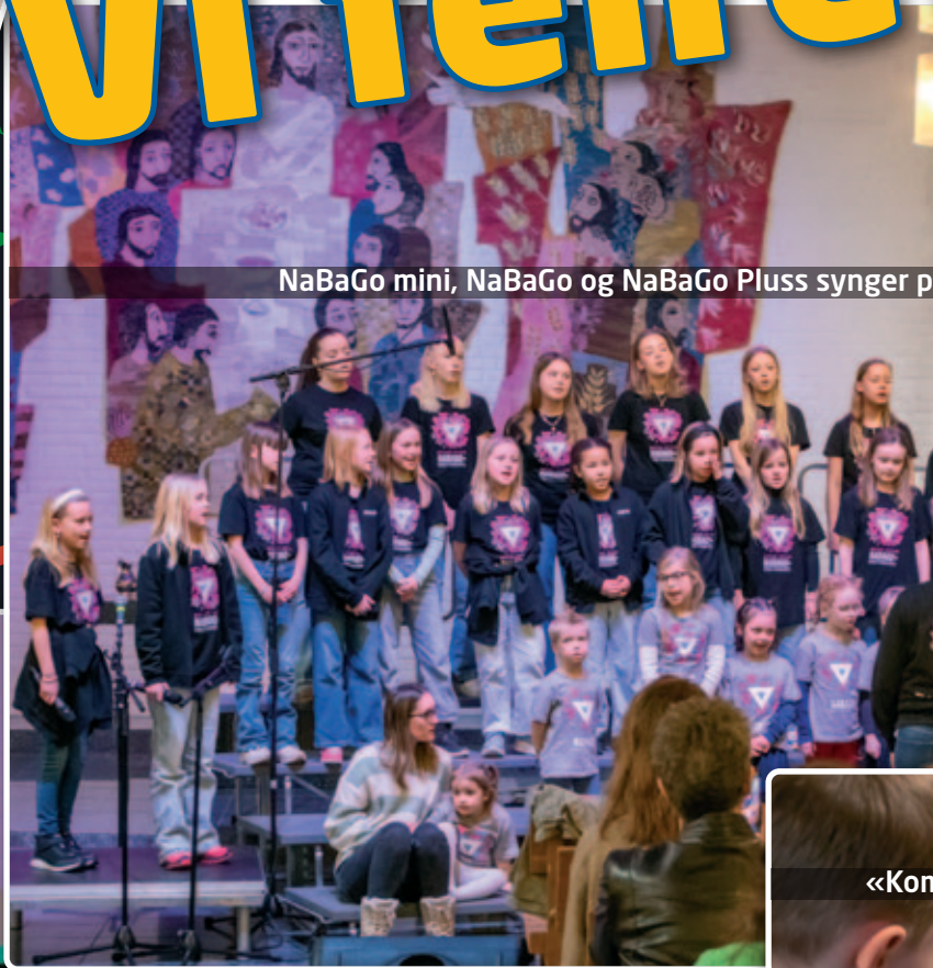
NaBaGo mini, NaBaGo og NaBaGo Pluss synger p