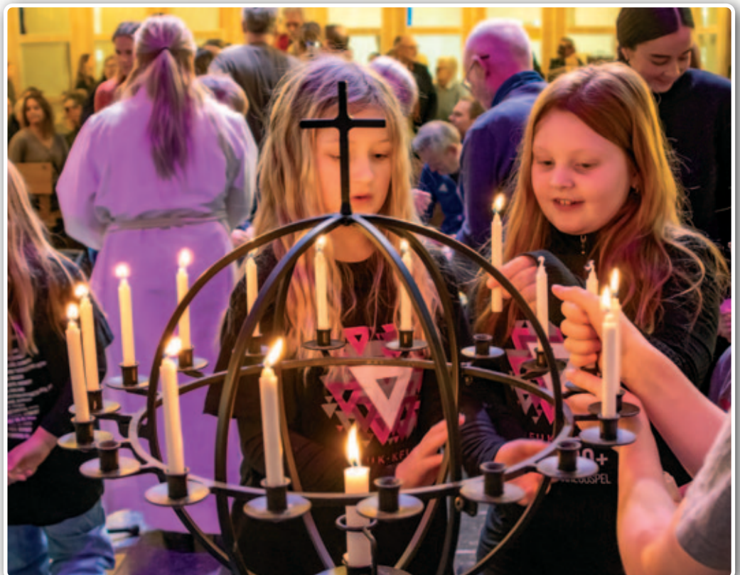
Fra jubelhelgas familiegudstjeneste i mars.