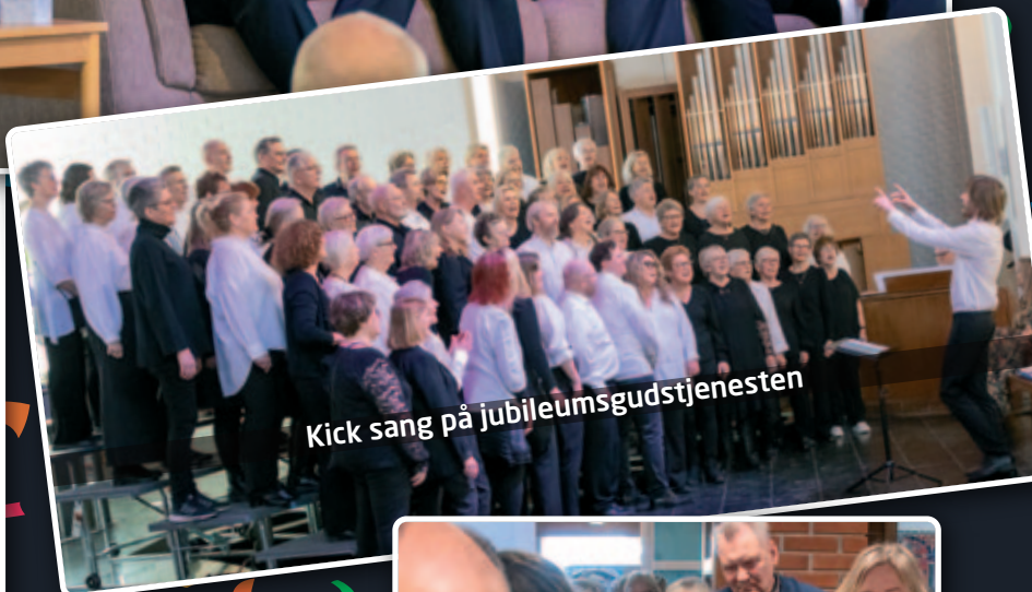
Kick sang på jubileumsgudstjenesten