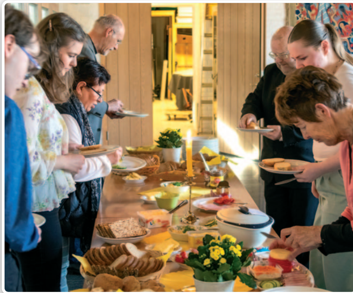
Velkommen til påskefrokost i menighetssalen på påskemorgen.