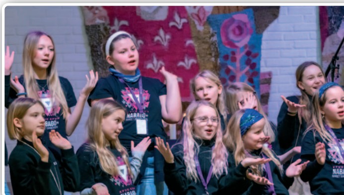
Tårnagentene og NaBaGo Pluss synger sammen.