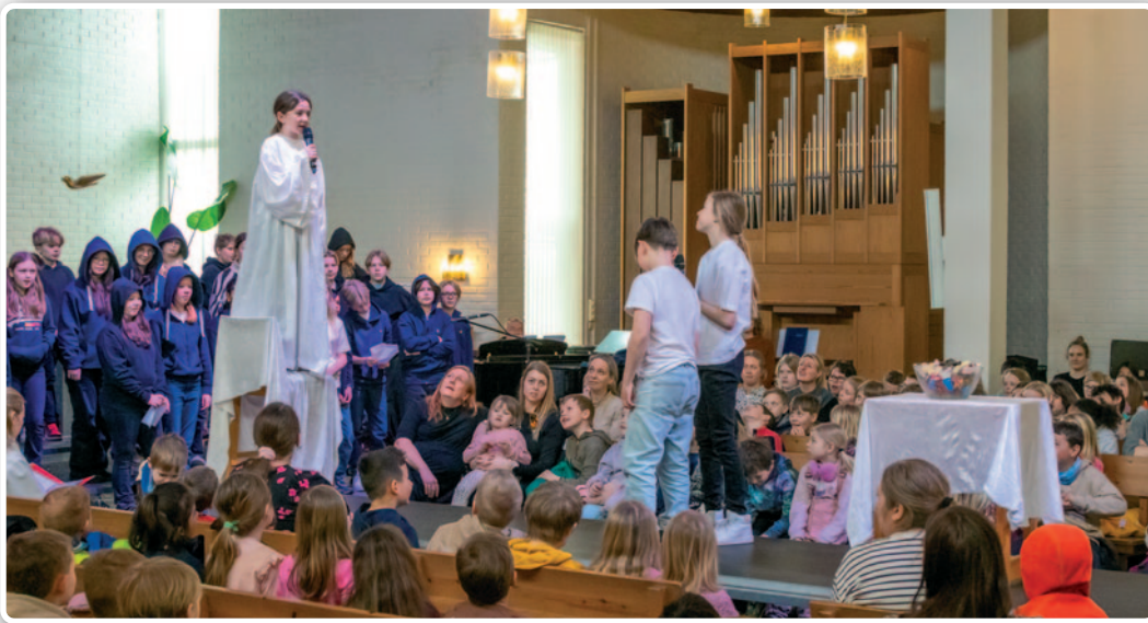
Fagerli skole skal fremføre sitt påskespill i Nanset kirke før påske. Her ser vi fjorårets.