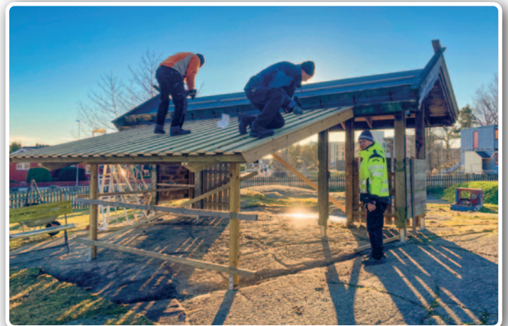
Portalen ble forlenget med tak og vegger.