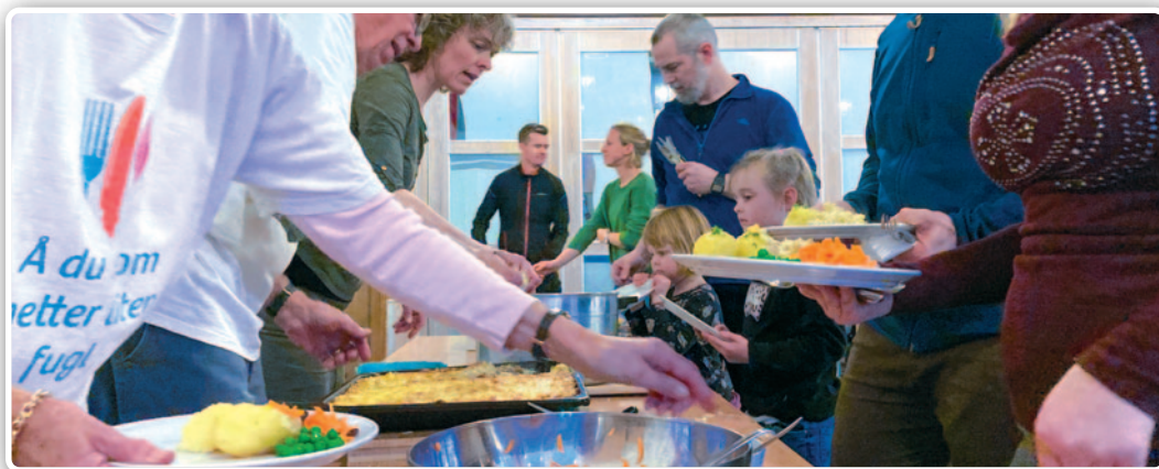
Kom og spis! hver onsdag kl. 16.30.

Siste Kom og spis! dette semesteret er 21. mai. Da kommer biskopen på besøk og vi steller i stand en real grillfest. Alle korene i kirken deltar på en storstilt konsert etterpå. Kom og bli med! ■