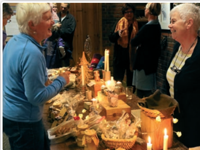
Mye fint å få kjøpt på salgsbordet.

Basaren i Nanset er årets dugnadsinnsats for å samle inn penger til det store barne- og ungdomsarbeidet som foregår i kirken.