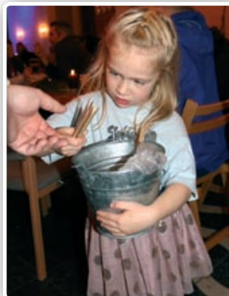
Åresalget gikk unna, med mange flinke hjelpere.