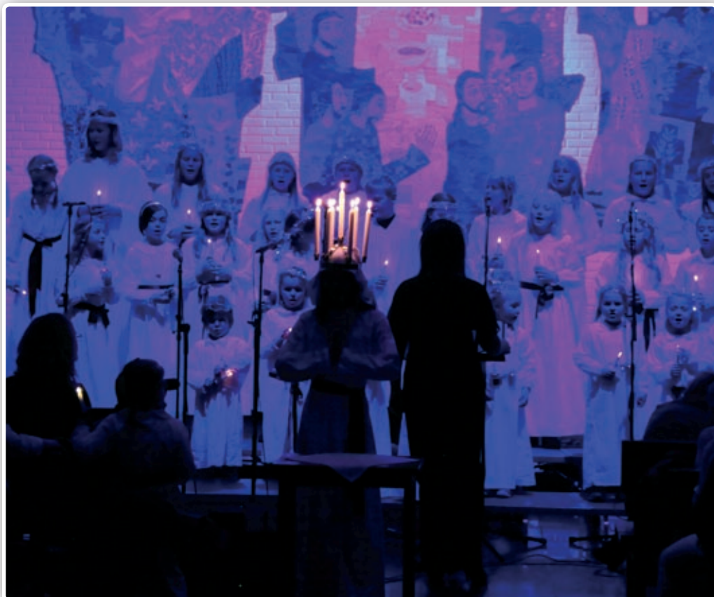
Fra NaBaGo-korenes Lucia-konsert i fjor.