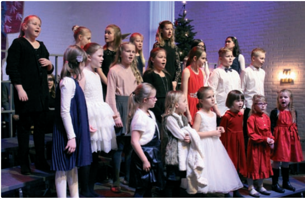
NaBaGo-korene synger på den første av julaftengudstjenestene.