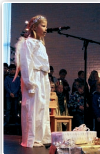
Skolegudstjenestene før juleferien er en god tradisjon i Nanset kirke.