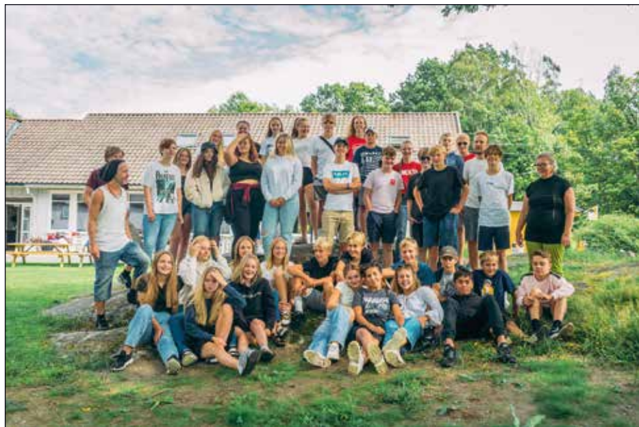
Fra Strand leirsted i fjor

Konfirmanttiden i Stavern menighet har godt rykte på seg, ikke minst på grunn av vår årlige HEKTA-leir i Kragerø. I fjor måtte vi erstatte denne med en lokal leir på Strand leirsted i Sandefjord, på grunn av korona.