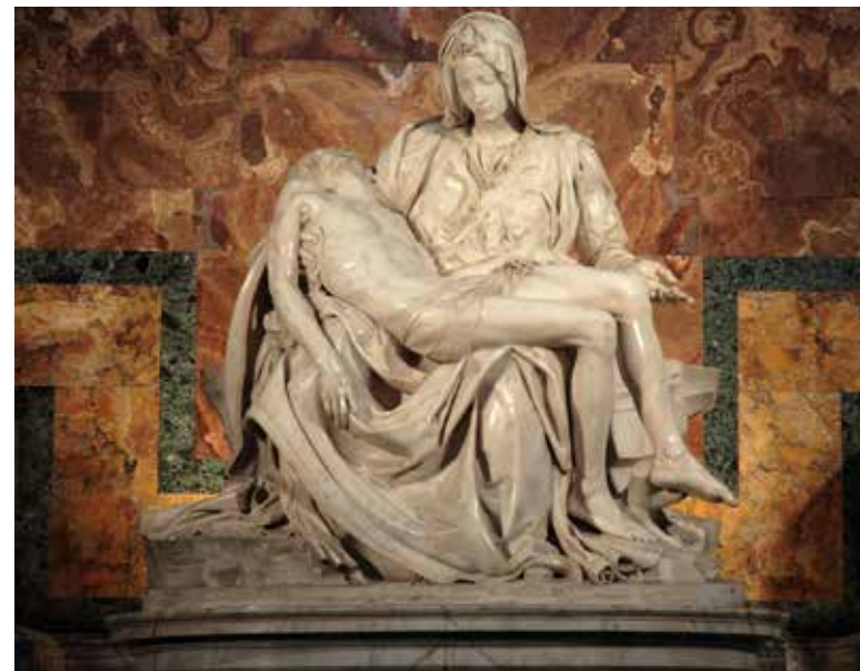
La Pietà, skulptur av Michelangelo i St. Peterskirken i Vatikanet i Roma