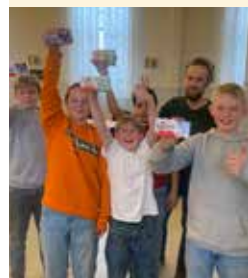
Etter skoletid (8.-9. klasse- gruppa)