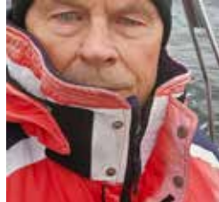
Tekst og foto: Yngve Rakke