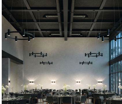
Bega – Uten opale sylindere – kommer også i hvit. Mindre fremtredende en den over.