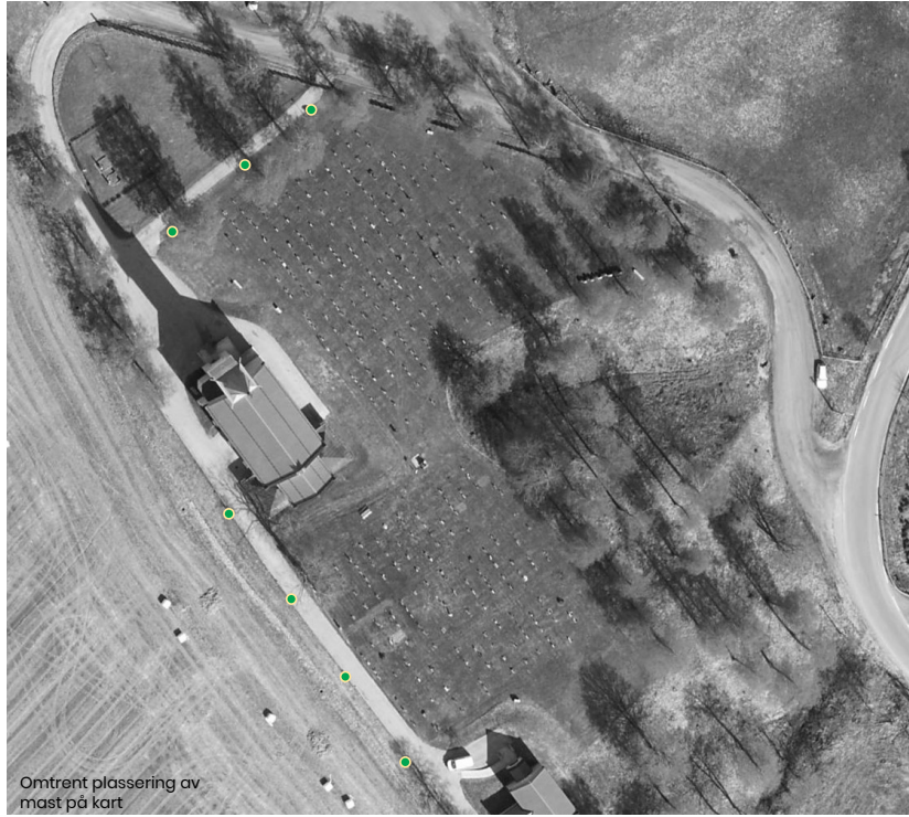
Omtrent plassering av mast på kart