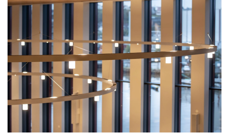
Frizen belysning spectral – Uten opale sylindere – kommer også i hvit. Mindre fremtredende en den over.