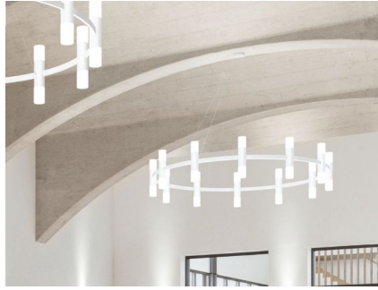
Bega – Ø 1,5m/2m/3m

I kapellet ønskes det ny belysning som står i stil til bygningens estetikk. Belysningen må gi god lesbarhet uten sjenanse. Ny belysning bør fremheve viktige deler av rommet.