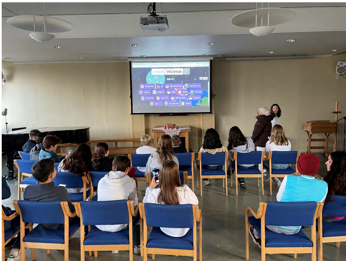
Diakonale tilbud for konfirmanter