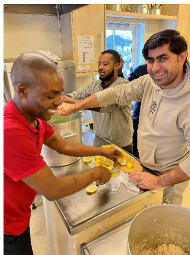
Diakonalt tilbud for flyktninger