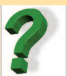
Organist (Sylling og Sjåstad)