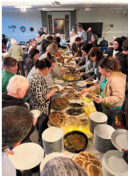
Festbordet var dekket, og alle var velkomne til å forsyne seg av maten, uavhengig av tro, kultur og religionstilhørighet.