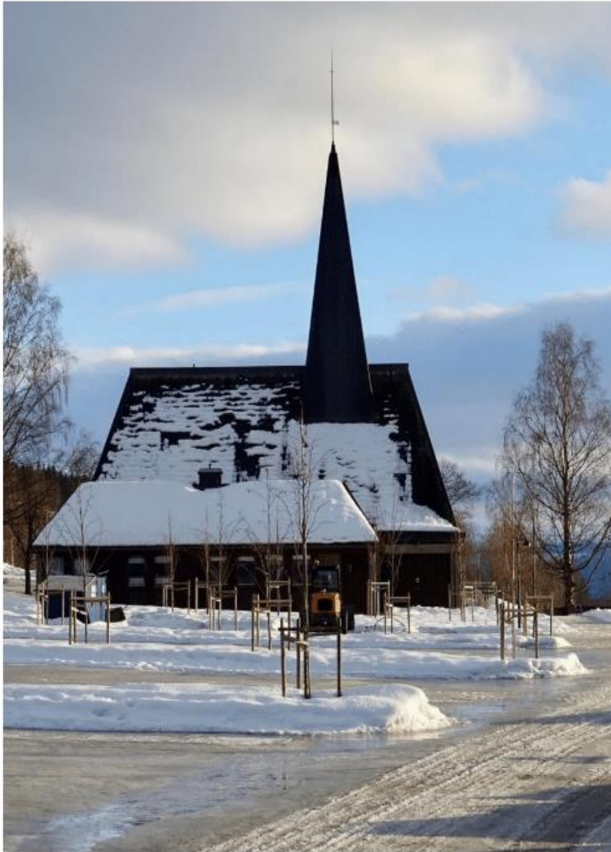
Søre Ål kirke med ny parkeringsplass og ombygd frontparti, mars 2017