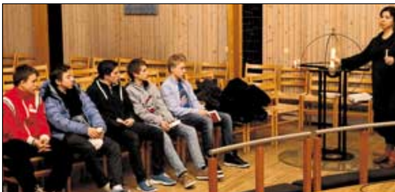
Presten en gruppe konfirmanter.

Noen torsdager har sognepresten vår undervisning for 66 konfirmanter. De der delt i 3 grupper., det foregår mellom