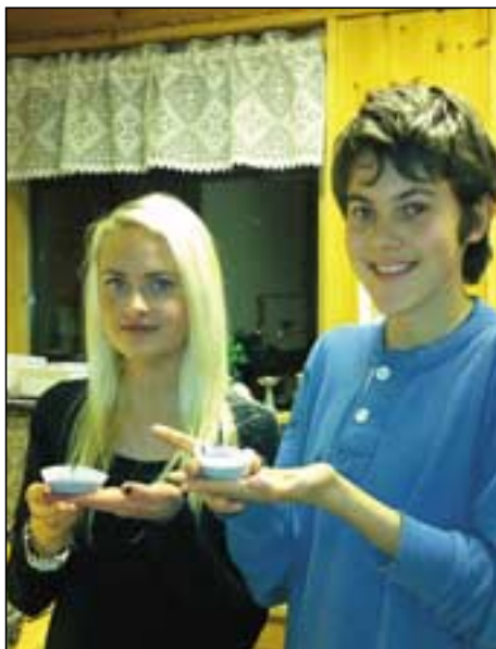
Muffins er godt!