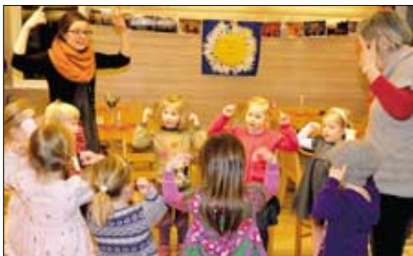
Chilipepper og ledere øver.

I løpet av en uke kan det skje noe nesten hver kveld i Søre Ål kirke og kirkekroken.