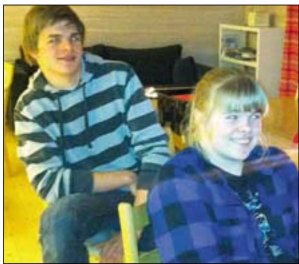
Vi koser oss med å se på film.