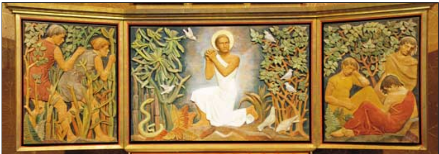
Altartavla i Lillehammer kirke.