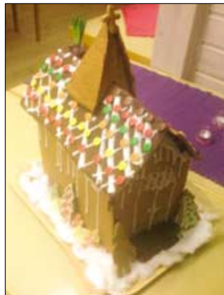
Pepperkakekirke! Vakker, ikke sant?