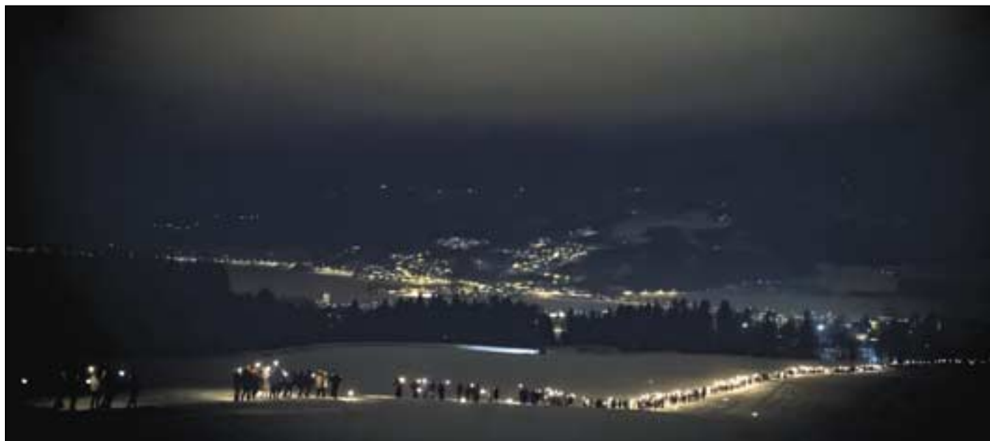
Unnarennet i Lysgårdsbakken ble brukt under åpningsshowet.