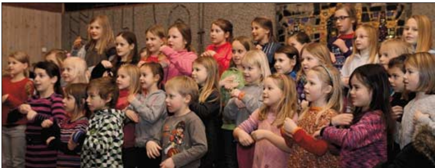
Kveldsavslutning i kirken.