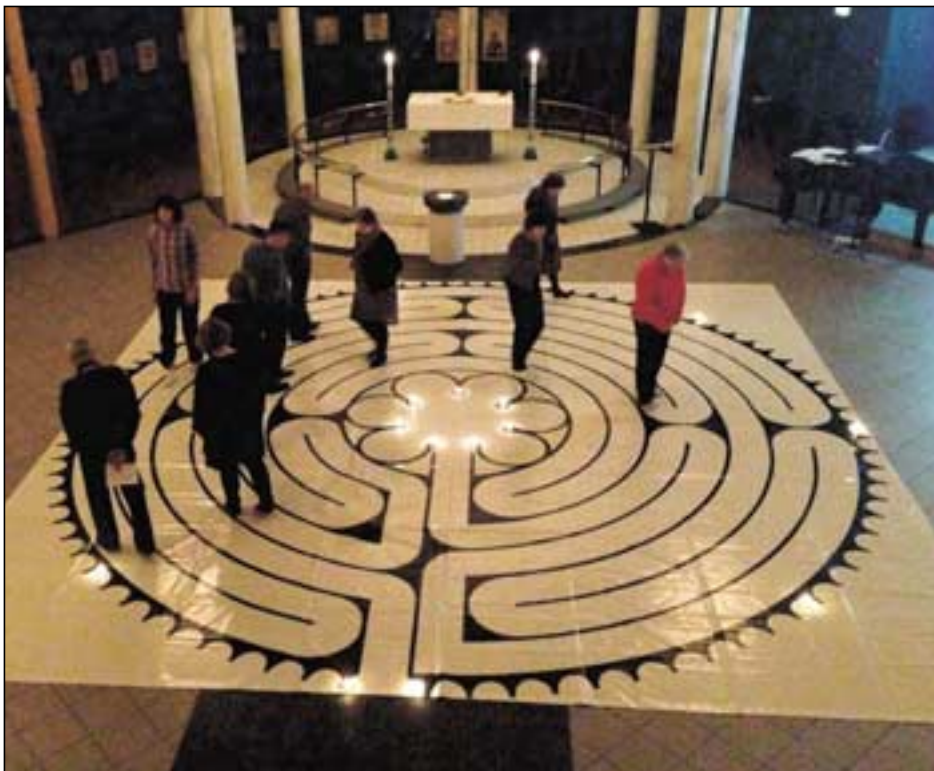
Labyrintvandring i Nordre Ål kirke.