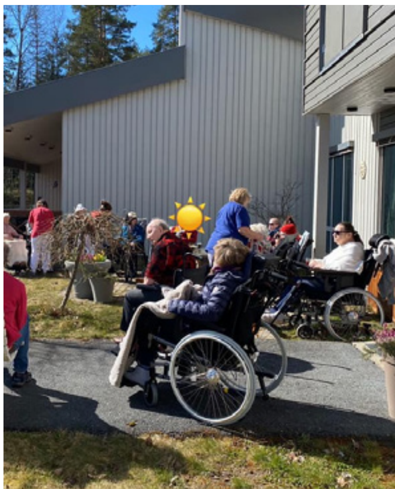
Fra Blaker bo- og omsorgssenter