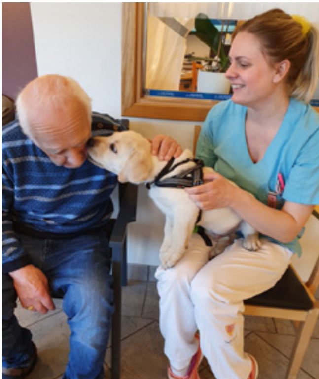
Hund på besøk .

Med gode forutsetninger til stede, kan livet fortsatt by på mange gode øyeblikk!