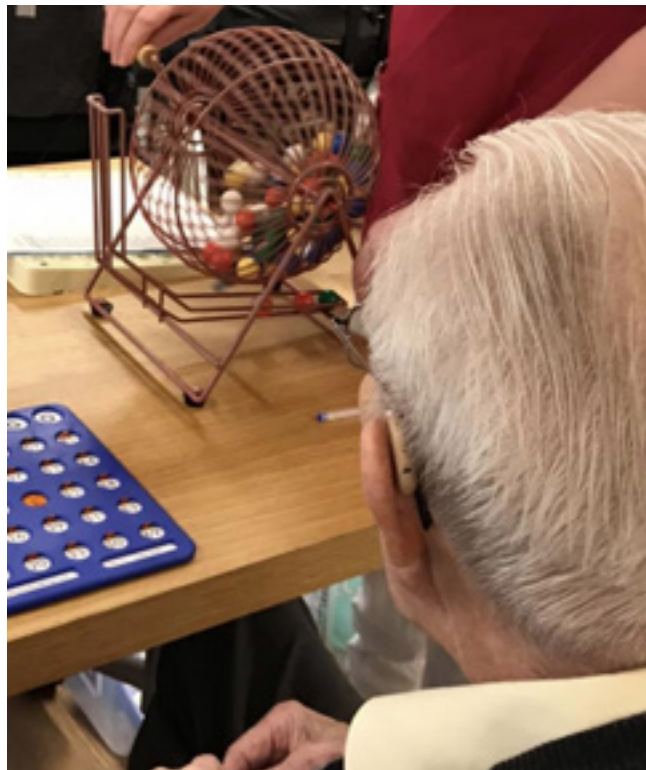
Bingo.