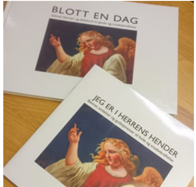
Litteratur redigert av Anne B. Jørgensen.

Anne fortsetter: I mine mange besøk på sykehjem har jeg sett hvor viktig det er å ta seg TID; tid til å håndhisse, vise ansikt, til å se hver enkelt og løfte dem frem. Ikke minst ser jeg hvor viktig