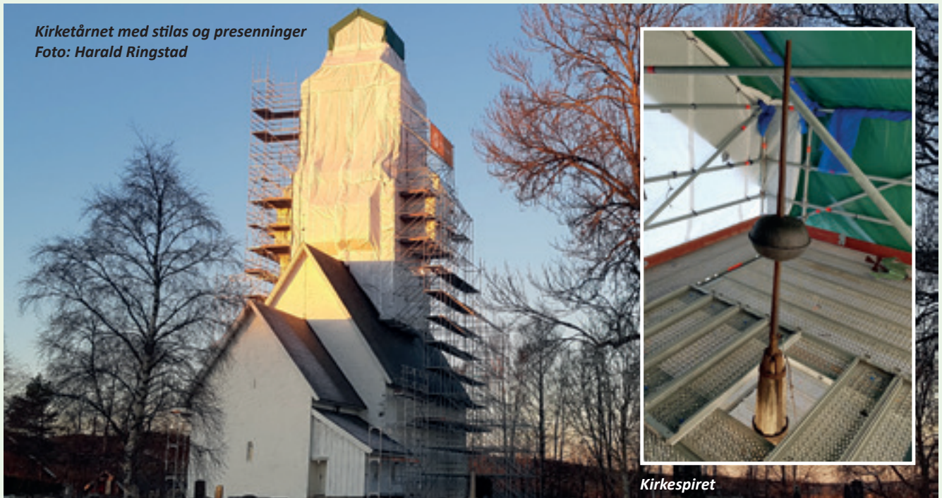
Kirketårnet med stilas og presenninger

Returadresse: Sørum kirkekontor Boks 25 1921 Sørumstrand