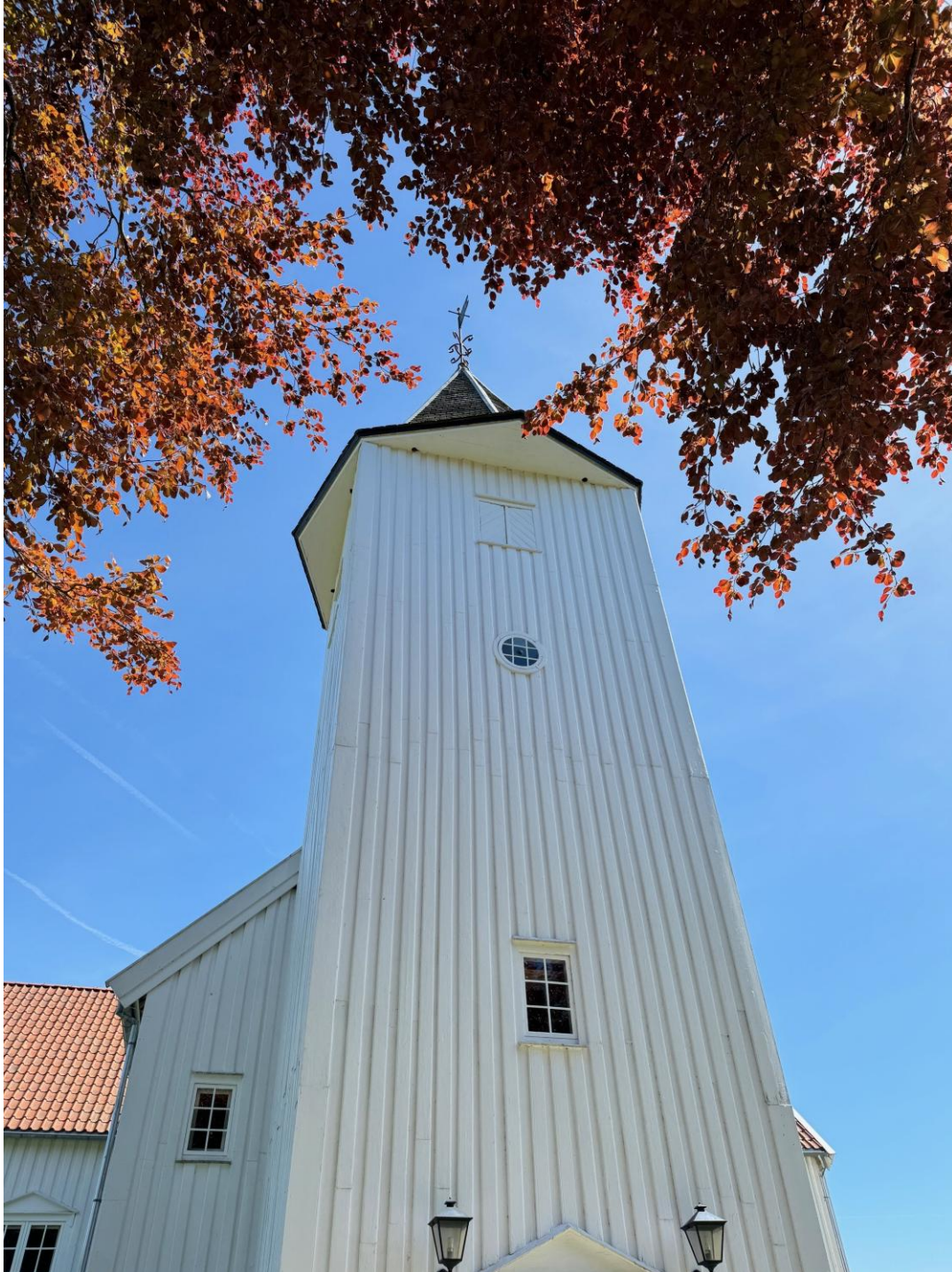
Holum kirke (1825)