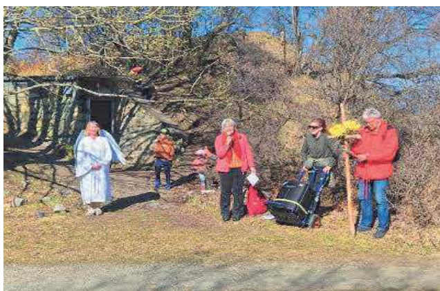
Bilder fra påskevandringen på Midtsandtangen 2. påskedag