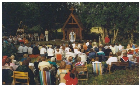
Gudstjeneste ved gjenåpning 1997