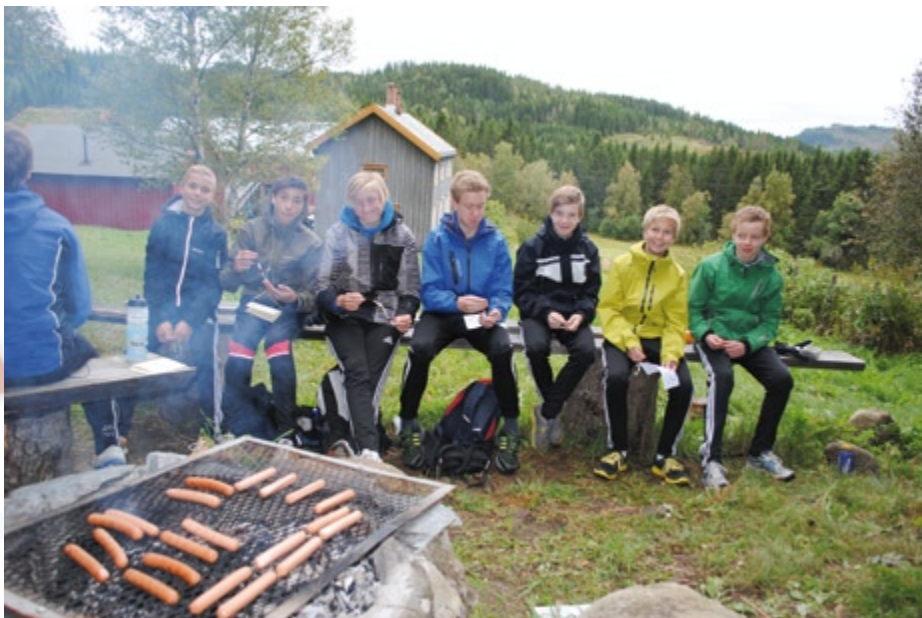
Nesten ferdig med kransen og nesten klart for pølser