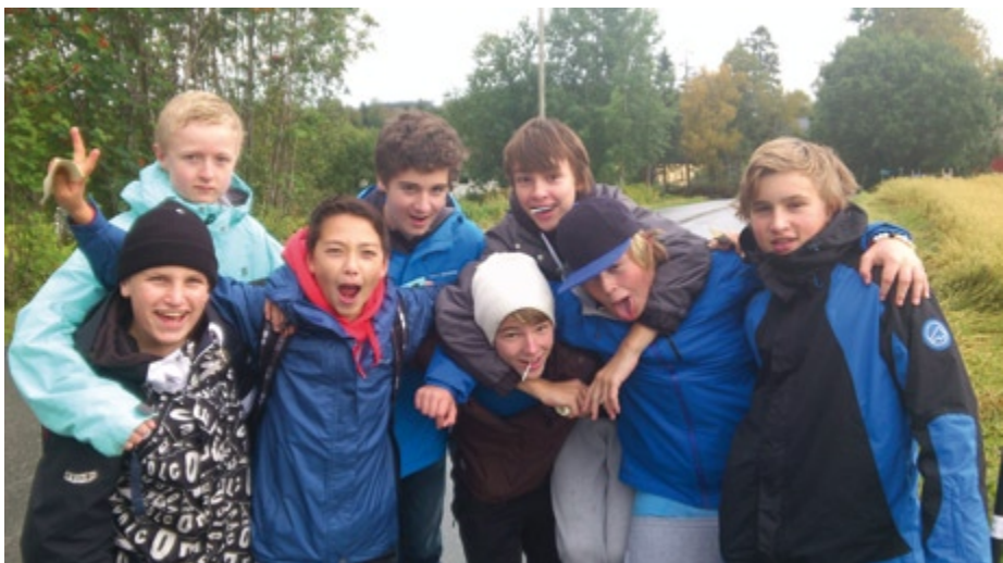
Her på veien fra Fjølstadtrøa til Saksvikkorsen