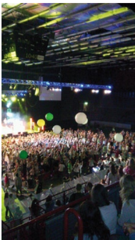
Fra et av showene inne i fjellhallen (Gjøvik)

- Den første dagen da vi alle på TT sto i inngangen på Fjellhallen, du hørte alle ropet og var glade. Alle fikk utdelt skjerf som vi skulle ha på oss, alle begynte å telle ned fra 10. Da vi var ferdige med nedtellingen, startet alle å springe mot plassene og vi kom heldigvis langt fram. Da satt vi i en mørk hall og ventet på at noe skulle skje. Da musikken startet og alle lysene var på, kunne du kjenne det store kicket i deg. Det var en hærilig opplevelse!