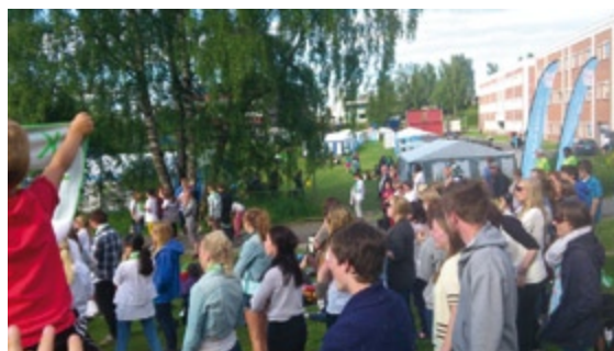
TT-torget med seminarer, workshops, kafe m. grilling, avslapping på gresset hvor man kan lytte til musikk fra scenen.