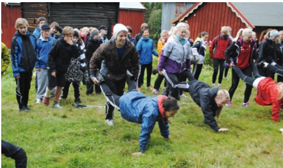
Lek på tunet