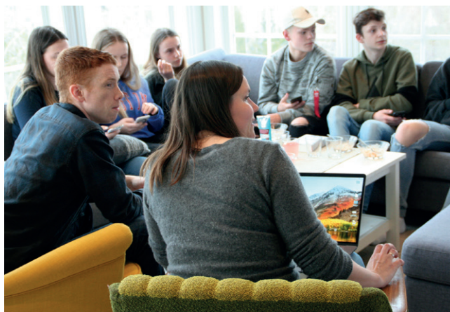
Konfirmantane er fordelt i grupper som møtes i ulike heimar i kyrkjelyden.