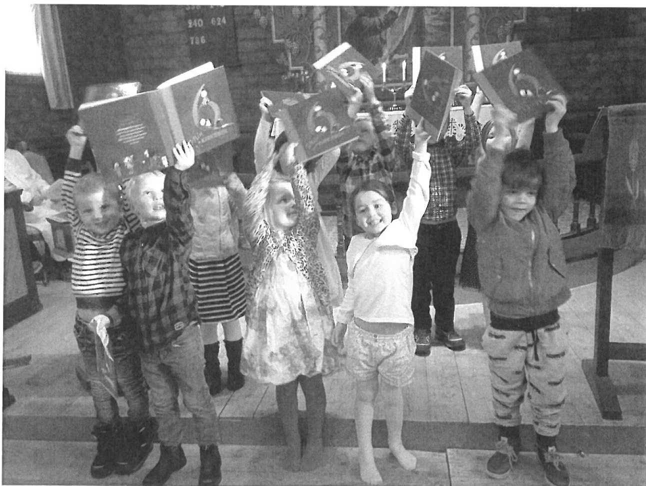
Utdeling av 6-årsbok, Flå kirke 5. februar 2017, (Mette Goa Hugdal, foto).

Menighetsrådet har ansvar for at kirkelig undervisning, diakoni og kirkemusikk innarbeides og utvikles i soknet."