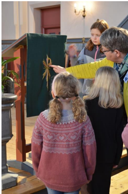
Tårnagentdag i Melhus kirke mars 2019