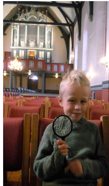
Tårnagentdag i Melhus kirke november 2019