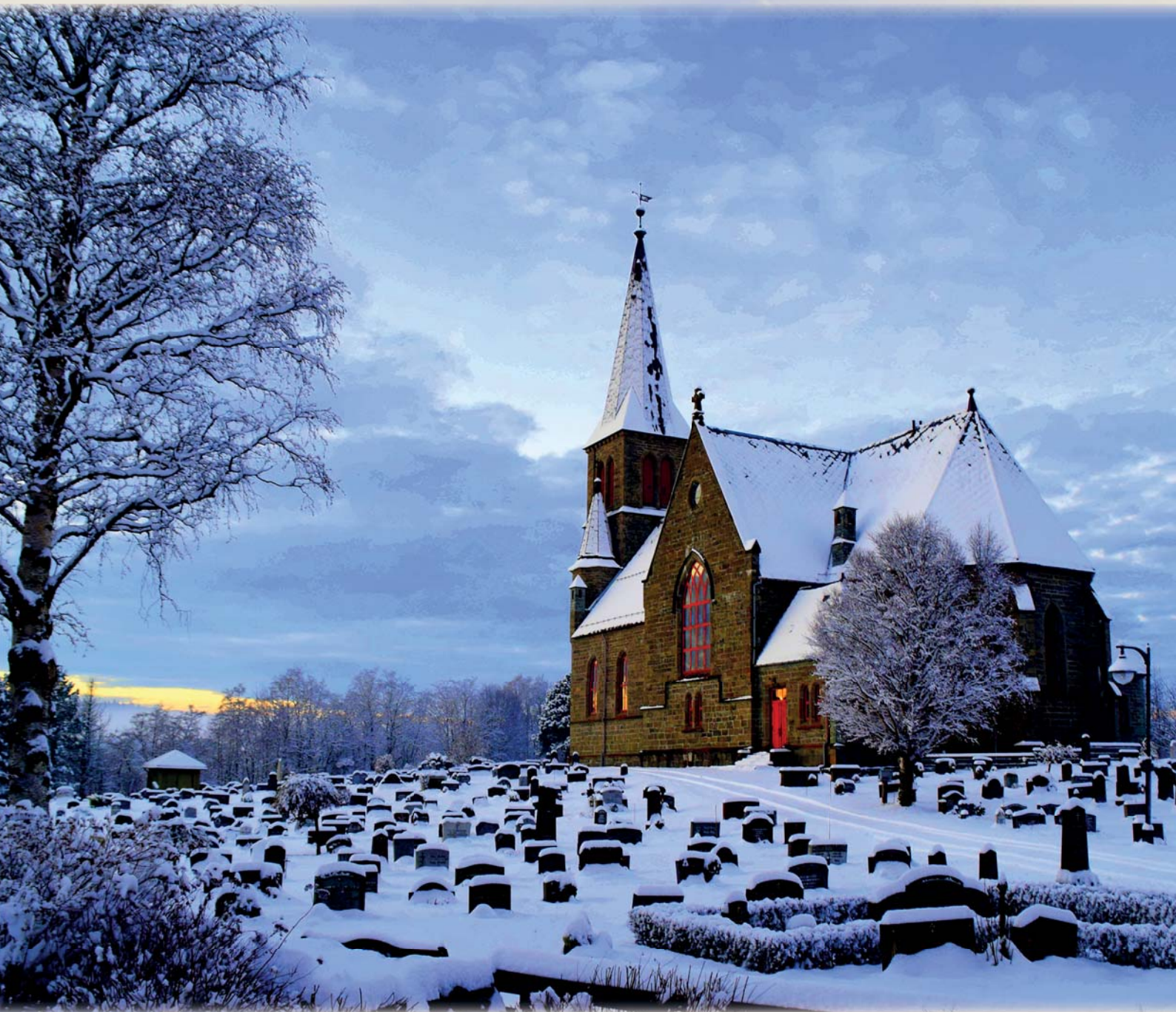
Melhus kirke, 125 år.

Menighetsblad for Melhus prestegjeld 4/2017, 77.årgang