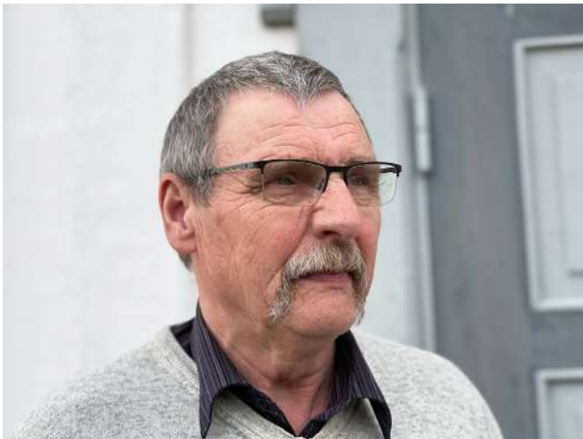
Pensjonert kirketjener.

Mye av arbeidet hans har vært utendørs. Plenklipping, beskjæring av busker og rydding av grusgangene har vært et viktig arbeid for å holde kirkegården så pen og trivelig som mulig. I starten av karrieren gikk han bak og skjøv en manuell plenklipper. Etter hvert fikk klipperen motor som drev kniven. Lettelsen ble enda større da plenklipperen fikk motorisert fremdrift og et sete å sitte på.