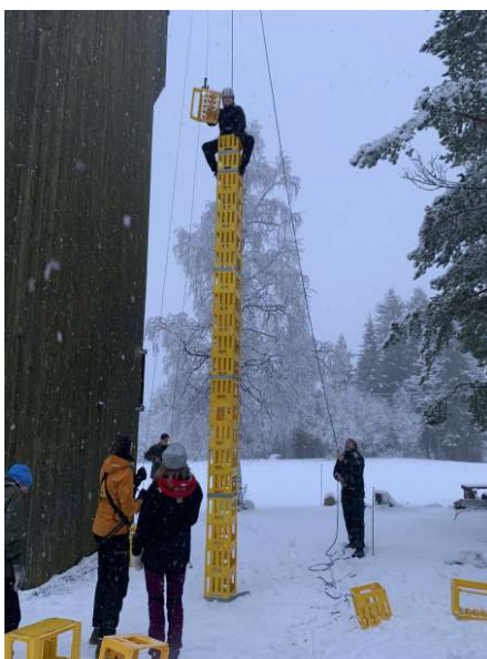
Bruskassestabling på årets konfirmantleir Vi ønsker alle konfirmanter 2023 velkommen til et innholdsrikt og spennende år!

Det er sokneprestene i Horg og Flå, og på Høllonda, samt kateketen som har ansvaret for konfirmantundervisningen i menighetene våre, men vi har hjelp av mange frivillige! Vi samler konfirmantene jevnlig til samlinger, og tilstreber at de skal møte ulike former for undervisning og opplegg igjennom året. Vi legger til rette for leir, pilegrimsvandring, temakveld, konsert og «vanlige» undervisningssamvær.