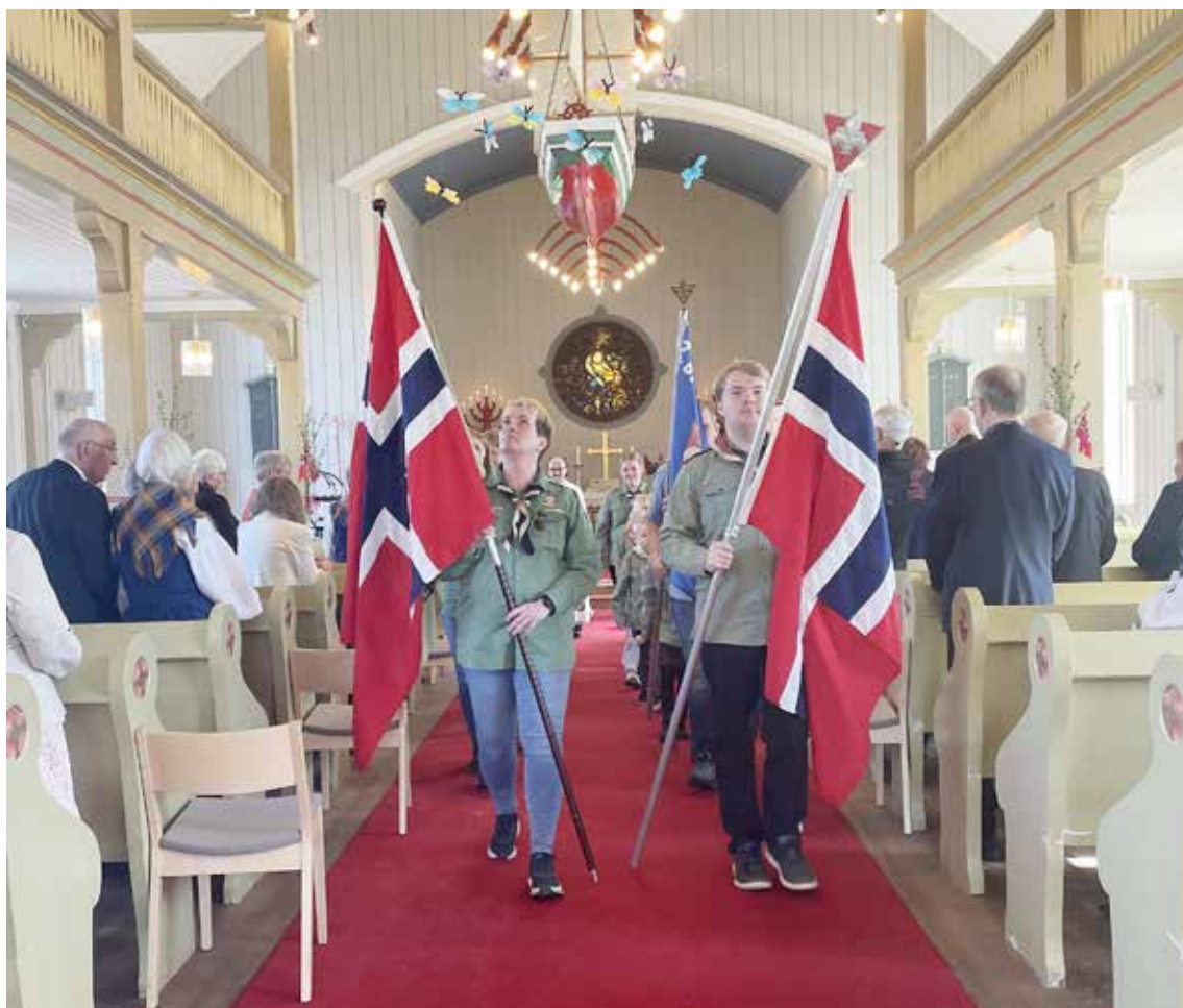
Speiderne i Ballangen deltok med flaggborg