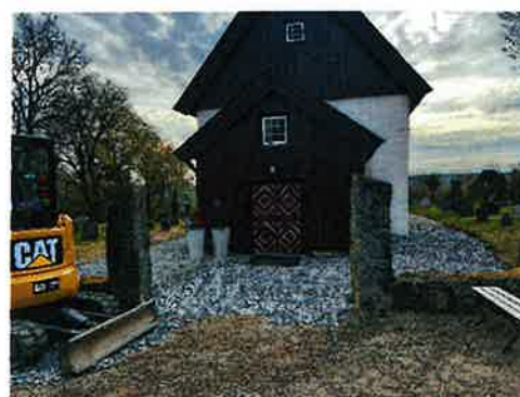
Bilde 1: Utbedring av drenering rundt Nesodden kirke

Det gjenstår gjennomføring av brannsikringstiltak, herunder installasjon av et sprinkleranlegg. Kapasitet i VA-anlegget anlagt i området må utredes og forbedres før et sprinkleranlegg lar seg realisere.