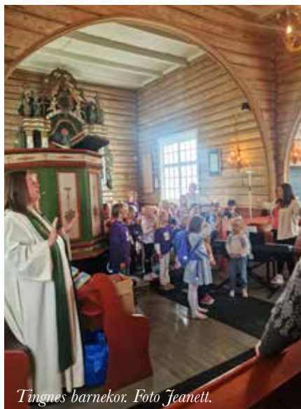
Tingnes barnekor.