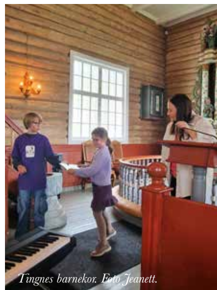
Tingnes barnekor.