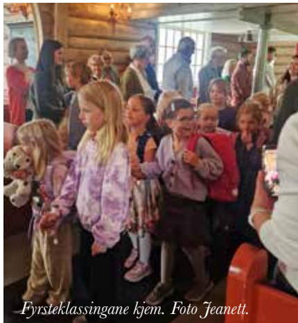
Fyrsteklassingane kjem.

Barna vart spurde om kva dei kunne gjera mot andre, kva som kan gjera andre glade – og dei hadde mange fine forslag: dele med andre, spørje om dei vil vere med i leiken, hjelpe til heime og å seia hei når nokon går forbi. Alle desse fine og gode tankane fekk barna teikne eller skrive om på eit hjarta som vi hang opp på den fremste kyrkjebenken i kyrkja under bønemandringa. Tingnes barnekor var også med i gudstenesta, og opptredde fleire gonger med mange fine songar for alle som kom i kyrkja. Det var veldig fint å sjå og høyre på det flotte barneket. I gudstenesta delte soknerådet ut 6-årsboka til fyrsteklassingane, og dei fekk med eit koseleg kort inni boka med namnet sitt på og ein lita helsing. Det var også sendt invitasjon til dei 11-åringane som ikkje hadde fått bilbel tidligare i år, og det kom ei blid jente frå Ranheimsbygda. Etterpå vart det servert heilt fyrsteklasses frukt og saft og kaffe, og mange vart att ei god stund etterpå for å teikne og fargelegge. Barna som hadde fått bok teikna i boka si med farger fra pennalene sine.