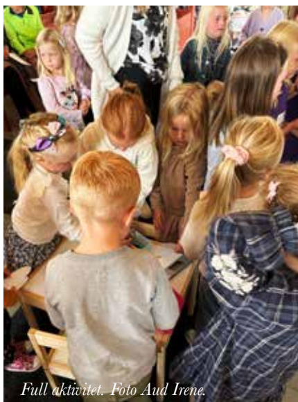
Full aktivitet.