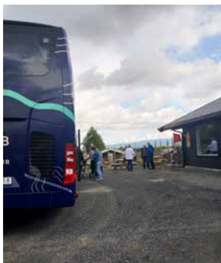
På tur med JVB i Ulnes Diakoni.

Takk for ein triveleg dag! Triveleg at så mange vart med.