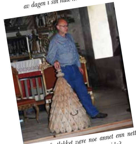
Kan døypefontlokket være noe annet enn nettopp det? Kan det ha vært et spir på utsida?