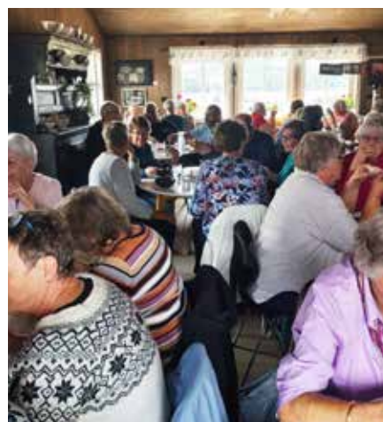
Mat på Langestølen.