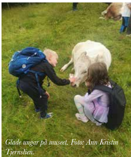
Glade ungar på museet.