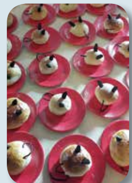
Alle borna fekk rotte-bollar då dei var på Kyrkjerotte-teater i Kvam kyrkje.