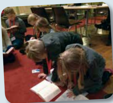
Tårnagentane fordjupar seg i den spanande Bibelen!