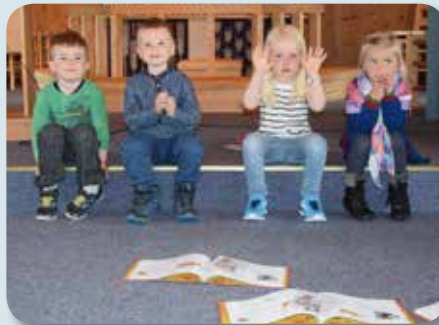
Flotte 4-åringar får bok i Sødorp kapell.