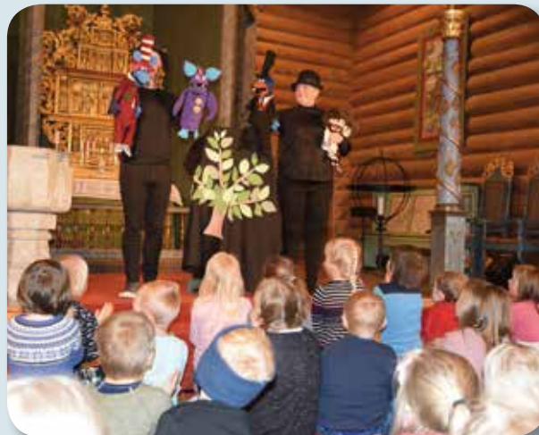
Kyrkjerottene og flaggermusa Viggo engaskerte borna, både store og små .....