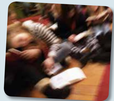
Full fart i Kvam kyrkje! Tårnagentane kviler ikkje!