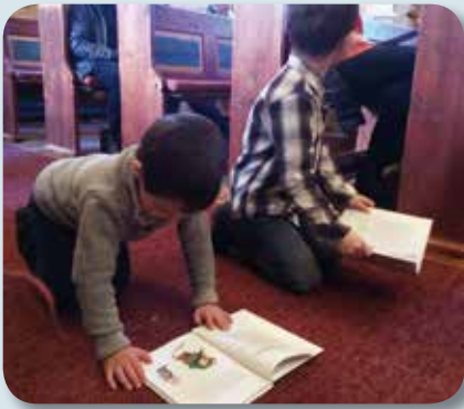
6-års-boka er spanande! Kvifor vente med å lese?