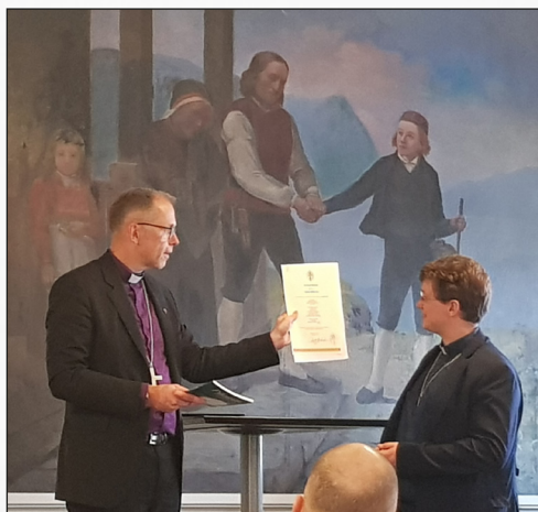
Frå Ynglingen og kyrkjekaffen. Bilde bak; den unge som vart sendt ut i verda, kan jo passe til den nye presten som har vorte sendt til oss i teneste i kyrkja.