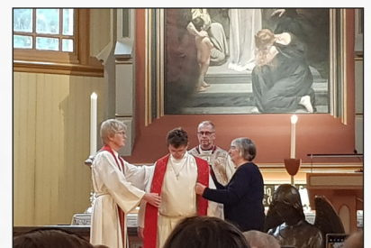
Stolaen vart lagt på den nyordinerte presten vår!