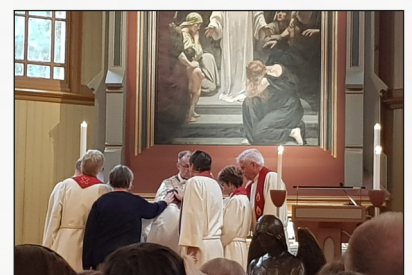
Frå forbønshandlinga ved ordinasjonen