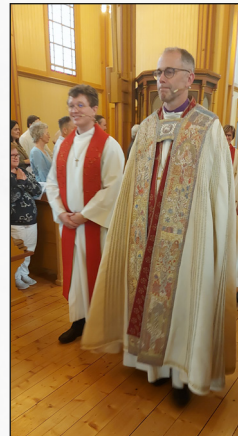
På veg ut etter gudsteensta saman med biskopen