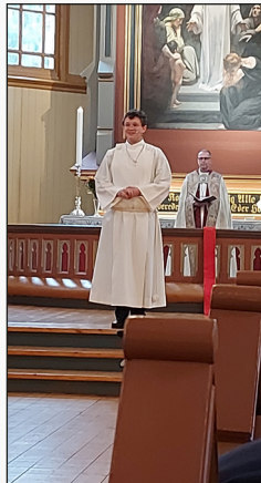
Ordinanden vart presentert for kyrkjelyden