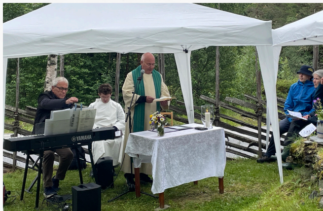
Utegudstjeneste i Bakkestugu.