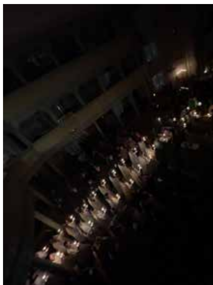
Inngangsprosesjon, lysmesse Åmot