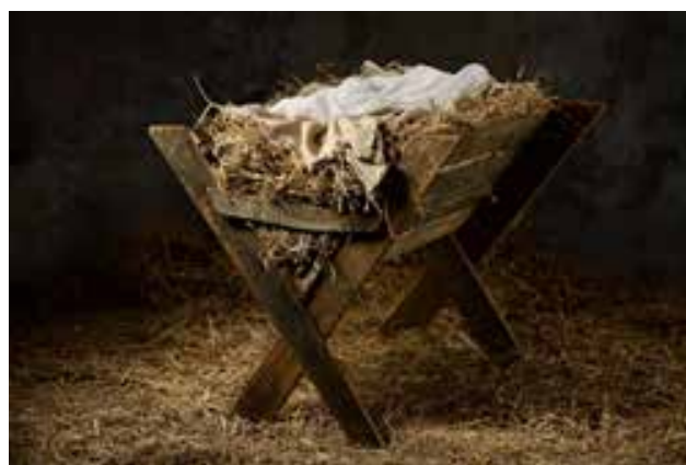
Tradisjonell julekrybbe.

Så hvordan forestiller vi oss scenen og krybba i juleevangeliet? De fleste tenker kanskje på noe som følger