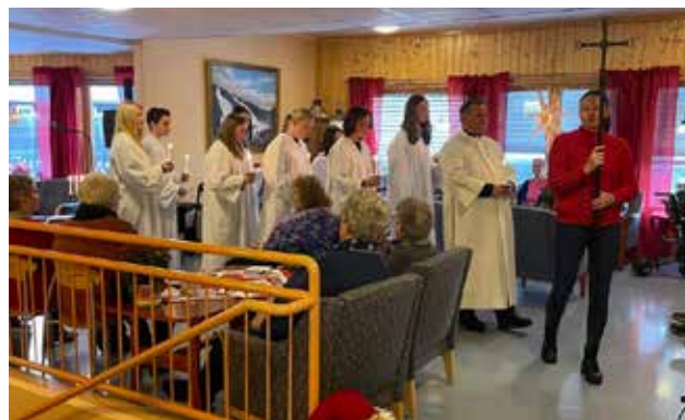
Lysmesse på Korsvold