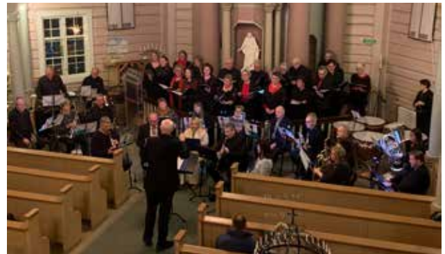
Nordsinni blanda kor og Dokka musikkorps