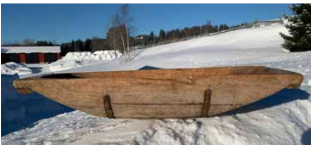
Bakstetraug. Fin plass til en baby!

På bildet kan man se at Jesus er lagt i en liten treboks. I Betlehem på Jesu tid hadde de trolig slike laget i stein, men uten at de da var like flyttbare som denne Jesu treboks. Og denne treboksen er betydelig mer flyttbar og kan kanskje ligne litt på et stort traug eller kar – enda det har en mye mer firkantet form enn hva en assosierer med et «traug». Til sammenligning, se på dette store bakstetraug: