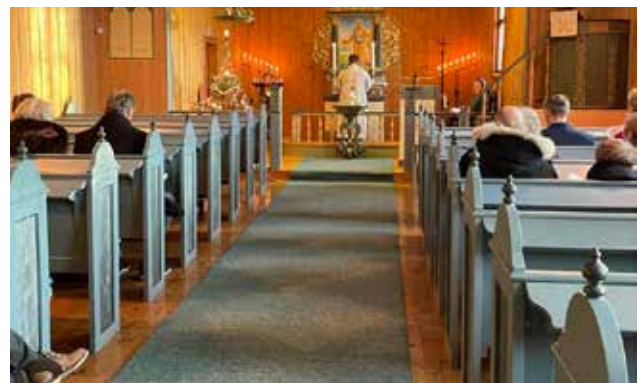
1.juledag i Kinn kirke