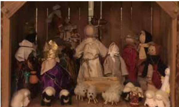
Jesus i julekrybba, lagt i en treboks.

Da er det kanskje bedre slik Åmot kirkes julekrybbe ser ut: