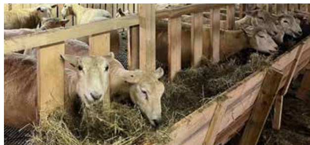
Krubbe for sauen. Her var det litt mye plass til en baby!

av juleevangeliet er veldig forsteinet av grunner jeg nå skal drøfte. «Krybbe/krubbe» refererer ellers til enkelte husdyrs fôrkasser