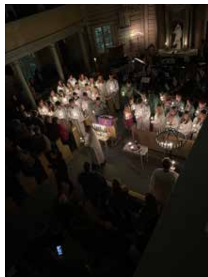
Lysmesse i Åmot kirke