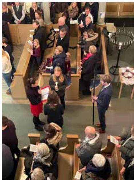
Juleevangeliet leses på torping